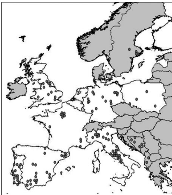
Figura 2. La presenza dei bilanci partecipativi in Europa (2007-2008)