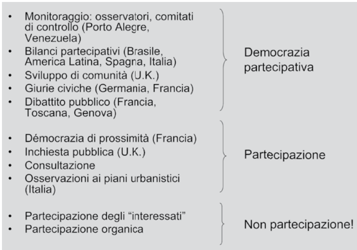
Figura 3. La scala d'intensità della partecipazione

no, pur su un piano di propositi che di realizzazioni, l'Unione Europea 45 . E giustamente si parla di transcalarità per indicare il riprodursi quasi come frattali (ma non del tutto) di forme similari ai diversi livelli, e di salti di scala ( scaling up ), a significare l'ascesa di esse dalla sfera municipale a quelle più elevate 46 (vedi Fig. 4).