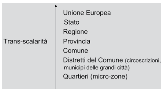
Figura 4. La scala territoriale delle pratiche partecipative

cali, cercando di disegnare un complessivo processo ispirato alla partecipazione dei cittadini 48 .