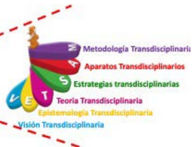
Niveles de los conocimientos transdisciplinarios de la realidad