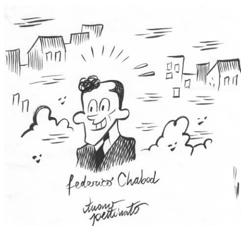
Figura 2 – Un disegno di Tuono Pettinato.