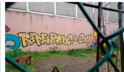
Exploring Florence Q5 - A mural drawn by the social centre group Occupazione Corsica 81, Rifredi railway area, April 2, 2022