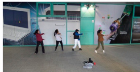
Exploring Florence Q5 - Street Dancers - Novoli Shopping Center, April 2, 2022