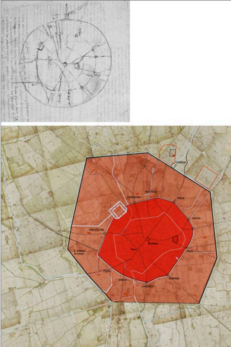
Figura 1. La Milano di Leonardo secondo lo schizzo del Codice Windsor; disegno di C. Candia. In alto: Leonardo da Vinci, pianta di Milano, particolare (Windsor RL 114r).

Quest'ultimo viene rappresentato attraverso un anello completo che si sviluppa anche nell'area di Porta Ticinese, tra il Naviglio Grande e la Vettabbia, dove in realtà non era presente (CANDIA 2017). Non si tratterebbe pertanto di una semplice schematizzazione dell'andamento reale del Redefossi ma di un progetto per una sua trasformazione.