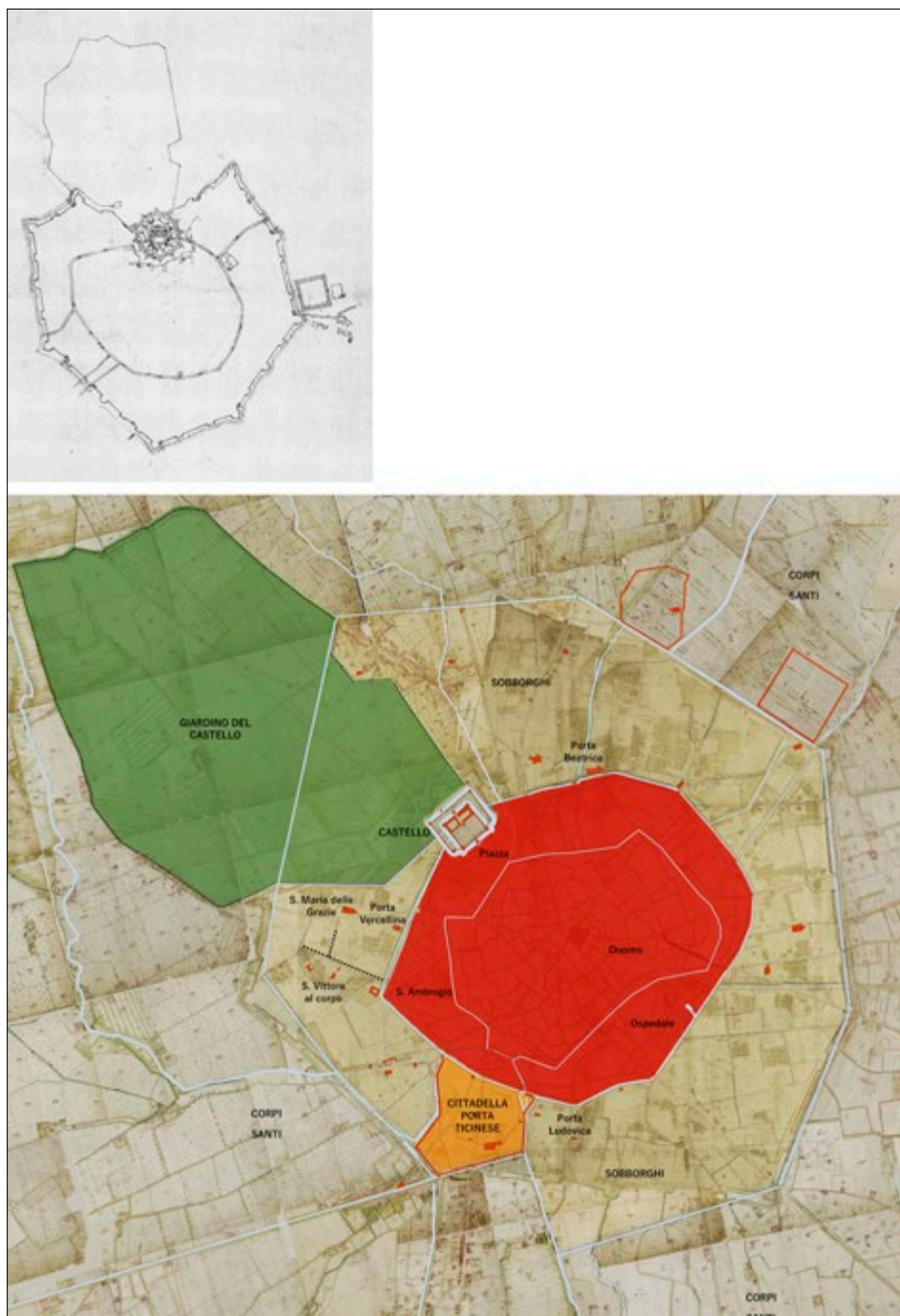
Figura 2. La Milano di Ludovico il Moro: il Castello sforzesco tra il giardino e la città medievale a fine XV secolo; disegno di C. Candia. In alto: Anonimo, Città, e Castello di Milano , XVII secolo, Archivio Storico Civico e Biblioteca Trivulziana, © Comune di Milano - tutti i diritti di legge riservati.