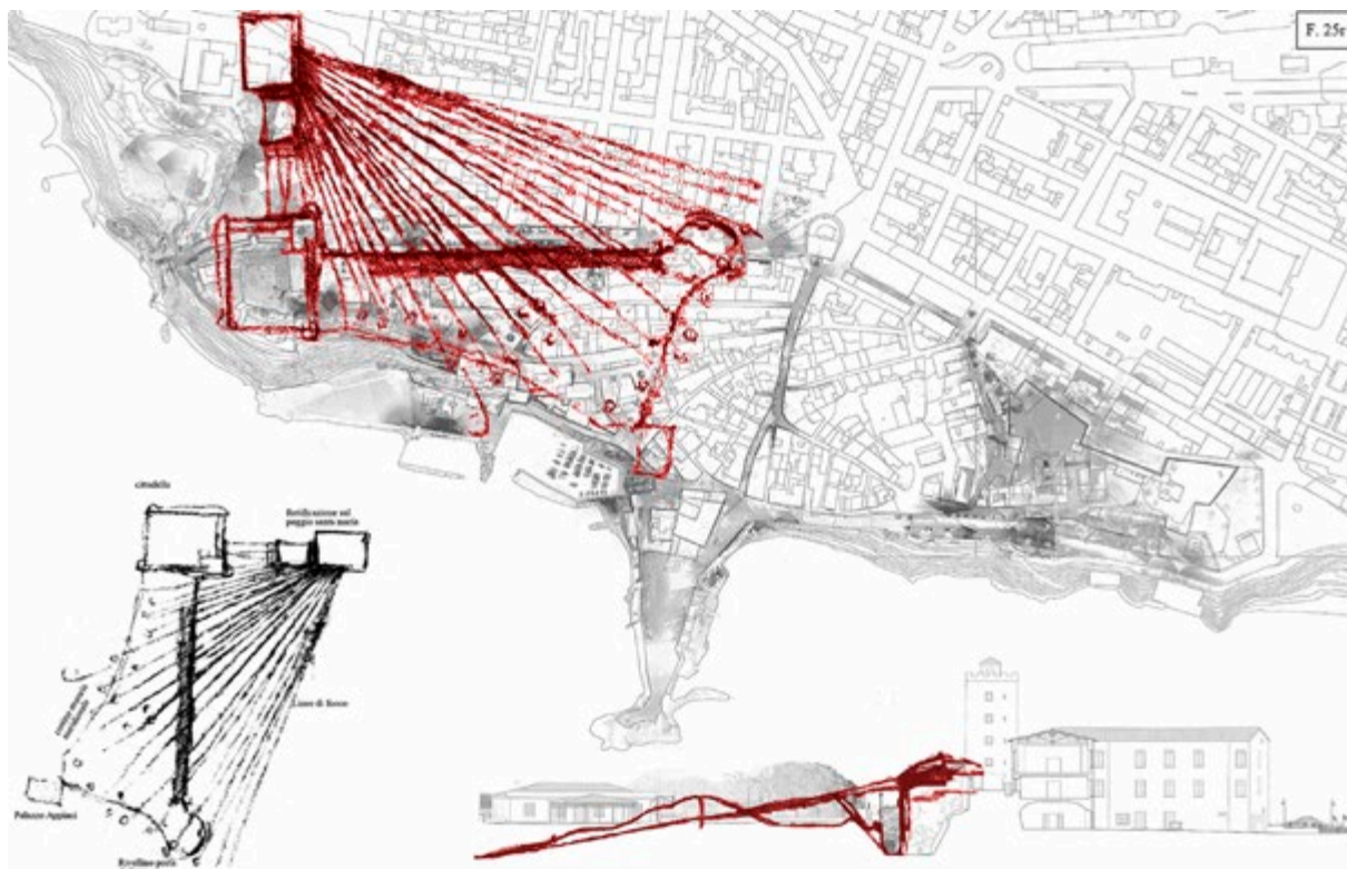
Figura 3. Scheda di analisi dei dati desunti da una delle pagine del Codice II di Madrid, il f. 25r. Dopo aver ridisegnato gli schizzi leonardiani, i risultati sono stati scalati, senza variare i rapporti dimensionali, e sovraapposti al rilievo architettonico per verificare le corrispondenze tra i segni grafici e le strutture oggi esistenti; il disegno è stato inoltre approfondito cercando di evidenziare le intenzioni della rappresentazione e di illustrare i significati degli oggetti rappresentati. Elaborazione degli autori.