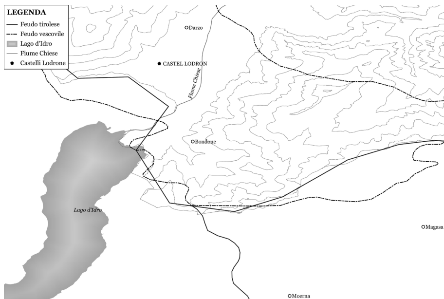
Cartina 2. Le originarie giurisdizioni della famiglia Lodron. Elaborazione a cura dei Laboratori integrati del Dipartimento di Culture e Civiltà dell'Università di Verona, Cartolab

mantennero quel vincolo di alleanza anche con l'uscita di scena della linea mainardiana dei conti di Tirolo. Il feudo della val Vestino sarebbe così stato riconfermato nel 1346 35 da Ludovico di Brandeburgo, sposo della contessa Margherita di Tirolo, e nel 1363 36 da Rodolfo della linea asburgica dei conti di Tirolo. Altrettanto decisiva nella costruzione della signoria fu la concessione feudale del 1307 del vescovo di Trento Bartolomeo Querini a Pietrozoto, figlio di Nicolò di Lodron, che sebbene non indichi espressamente l'oggetto della concessione, stava alla base dei diritti giurisdizionali più avanti esercitati dalla famiglia. Per la loro conoscenza dobbiamo, infatti, risalire al 1361 37 , quando, dopo la morte di Parisino di Storo, i tre figli Antonio, Pietrozotino e Parisino, entrati in conflitto con lo zio Albrigino, addivennero alla separazione dei beni patrimoniali, lasciando tuttavia indivisi proprio i diritti giurisdizionali.