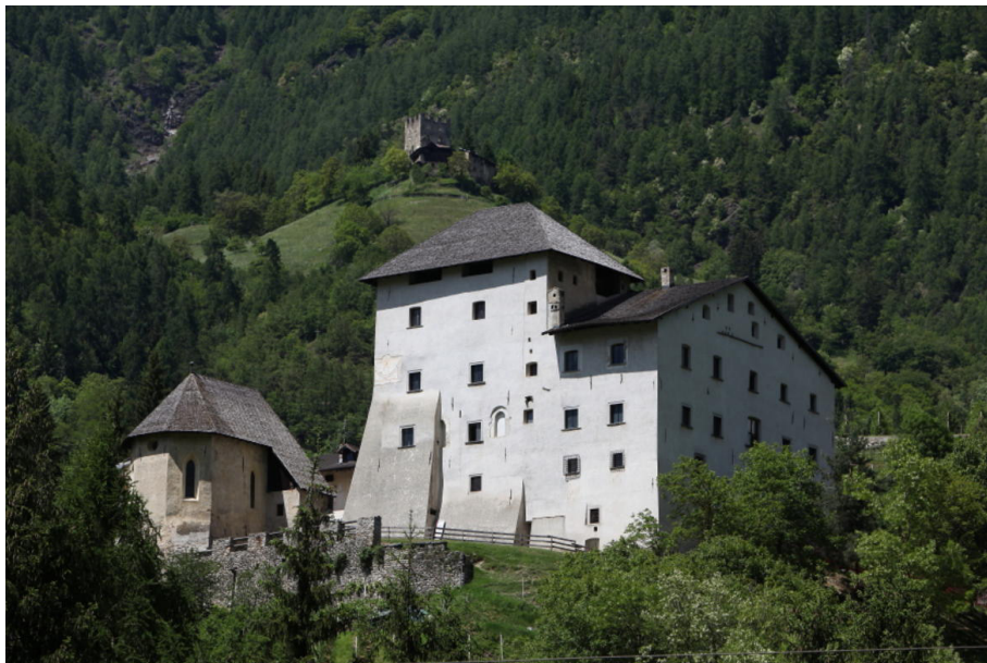
Figura 1. Castel Caldes e la Rocca di Samoclevo. Foto di Claudio Clamer. Provincia autonoma di Trento, Soprintendenza per i beni culturali, Ufficio beni architettonici.

Non, da cui si distaccarono al principio degli anni Trenta del Duecento quando dai vescovi Gerardo e Aldrighetto ottennero la concessione di costruire un nuovo castello sul dosso eponimo (Figura 1.), traendone un cognome che diventa definitivo nel penultimo decennio del secolo 29 . Volcmaro di Burgstall infine, originario del villaggio di Tirolo presso Merano, fu infeudato nel 1333 dal conte del Tirolo del castello di Sporminore, trasmettendo ai suoi discendenti il cognome de Sporo , anch'esso al principio del Quattrocento affermato nella forma tedeschizzata Spaur 30 .