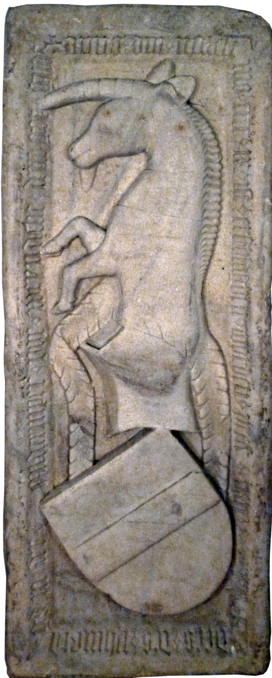
Figura 6. Lastra sepolcrale di Pretele (Prechtel) di Caldes († 1409) nella cripta della parrocchiale di Wilten presso Innsbruck. Foto di Walter Landi edita in: Alberto Mosca, Caldes. Storia di una nobile comunità , Comune di Caldes, Nitida Immagine Editrice, Cles (TN), 2015, p. 160.