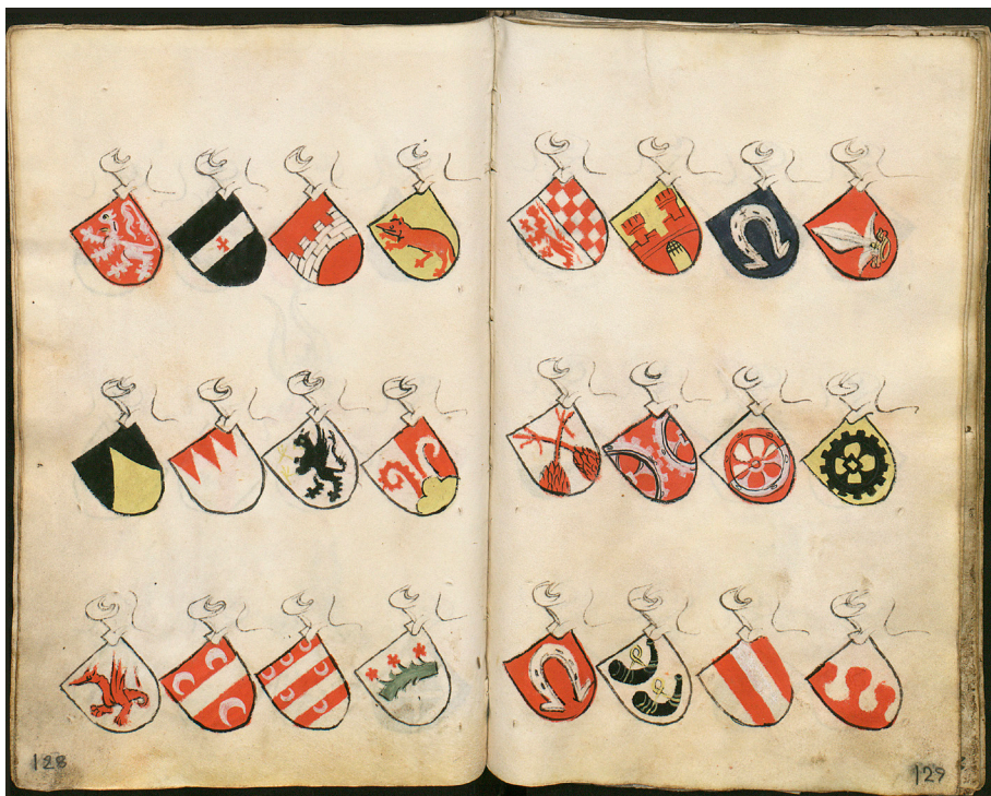
Figura 15. Bergshamer Wapenbok , del 1441-56. Le due pagine qui riprodotte presentano alcuni stemmi d'area trentino-tirolese, fra i quali quelli dei Castelbarco (1), dei Kronmetz (9), dei Firmian (11), dei Rottenburg (14). Stockholm, Riksarkivet, Bergshammer vapenbok , SE/RA/720085/Z, pp. 128-129.

rolese in stemmari tre-quattrocenteschi di provenienza italiana: solamente il Codice Trivulziano , compilato attorno al 1450/61-1466, riporta quello dei d'Arco 113 .