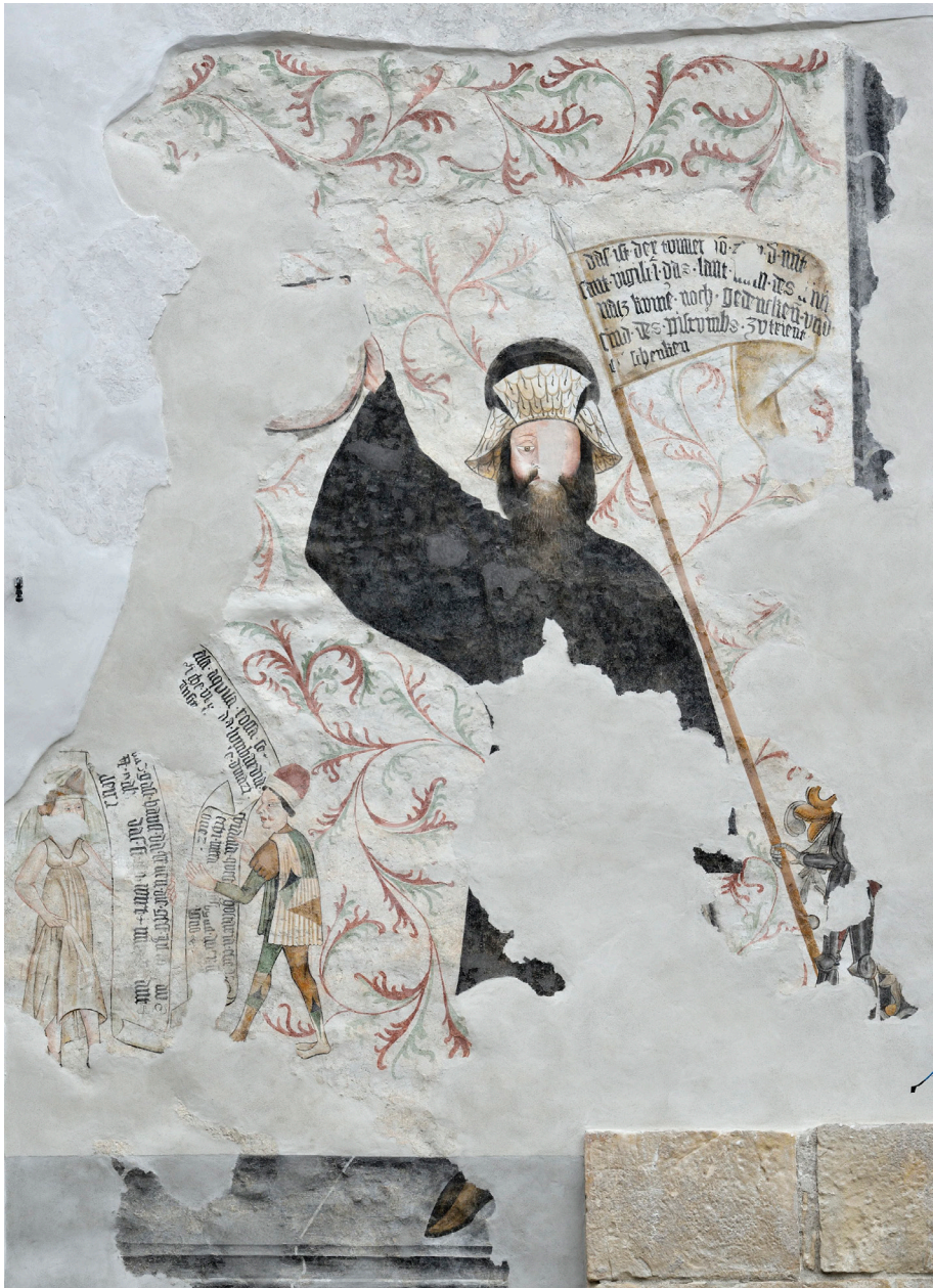
Figura 16. Affresco raffigurante il capostipite leggendario dei Thun. Sullo stendardo, in tedesco, riproposizione della leggenda familiare secondo cui questi sarebbe giunto nel territorio di Trento da Roma, al seguito di san Vigilio, dipinto fra il 1474 e il 1503, o più verosimilmente fra il 1430 e il 1448. San Michele all'Adige, locanda all'Aquila nera, parete ovest.