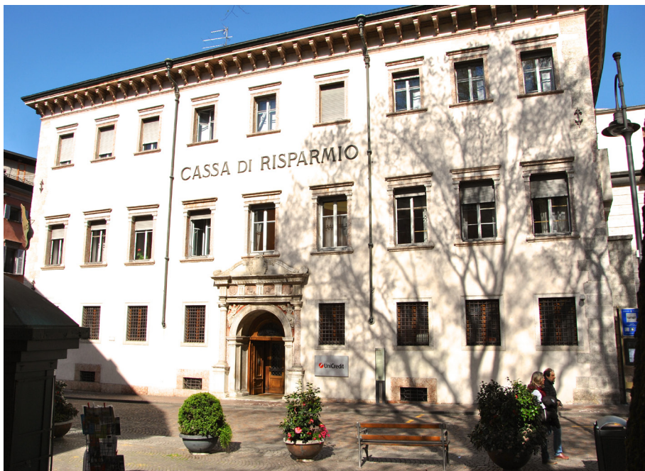
Figura 2. Palazzo Firmian a Trento.

Cinquecento 39 . Per molti di costoro – ma dalla fine del XVI secolo, cioè ben oltre il terminus post quem qui considerato – è probabilmente più significativo il «passaggio alla residenzialità di palazzo» che identifica la piena realizzazione del percorso signorile con la «discesa dal castello al borgo» 40 : e sono quindi i casi del palazzo di Nogaredo costruito dai Lodron nel 1593, della casa dei Thun a Revò risalente alla fine del secolo, del castello di San Giovanni, cioè la residenza edificata a Brez nel 1585 da Guglielmo d'Arsio, dei cinque palazzi dei