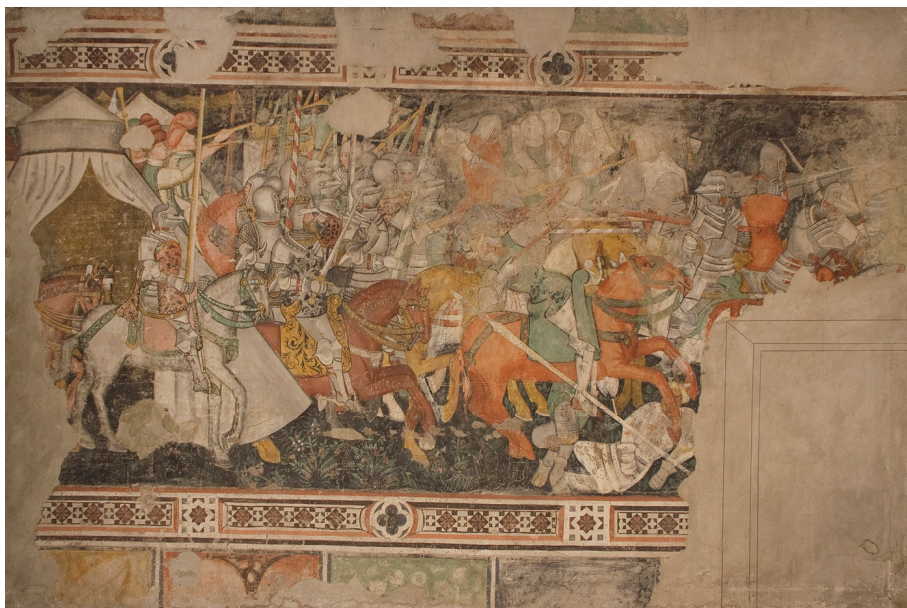
Figura 12. Scena di battaglia tratta da un poema arturiano, 1442 circa. L'affresco proviene da Castel Romano nelle Giudicarie, dove si conservava fino al 1913. Trento, Museo Diocesano Tridentino, Inventario diocesano .