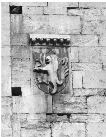
Figura 5. Stemma Castelbarco sul prospetto meridionale della cattedrale di Trento, 1319.

bensì nel chiostro del monastero di Novacella/Neustift 76 . Nel cimitero vecchio del Duomo di Bressanone, dove fu traslata a fine Settecento in occasione della ricostruzione tardobarocca della cattedrale, si trova invece quella di suo nipote, il canonico Ezzelino III di Egna († 1373) 77 . Di poco posteriore a questa lastra è un'altra lapide relativa agli Egna, cioè quella di Guglielmo IV, signore di Castel Forst (Merano), caduto a Sempach nel 1386 al seguito del duca Leopoldo III d'Austria. Egli riposa assieme ad altri due cavalieri della regione, cioè Friedrich Tarant e Peter von Schlandersberg, nella chiesa conventuale di Königsfelden (Aargau), sotto una lapide recante gli stemmi di tutti e tre 78 . La lapide stemmata di Pretele da Caldes († 1409) si conserva invece nella cripta della chiesa parrocchiale di Wilten, presso Innsbruck, dove questi era caduto vittima di un agguato (Figura 6) 79 , mentre quella di Heinrich (VI) von Rottenburg († 1411), dinasta di Castelfondo e di Caldaro, si trovava un tempo nella chiesa dell'Ospedale di Santo Spirito a Caldaro, da lui fondato poco pri-