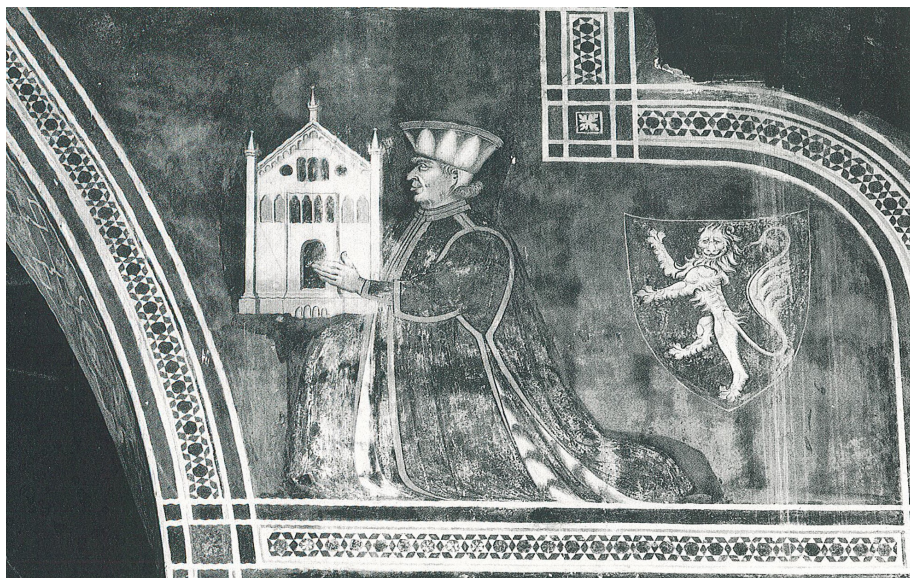
Figura 10. Ritratto ad affresco di Guglielmo “il Grande” Castelbarco († 1320), Verona, chiesa di San Fermo, archisesto del coro.

Qualche anno dopo, nel 1397, il ramo dei Castelbarco-Albano erigeva quindi un proprio sepolcro presso la pieve di Mori, nella propria cappella di Santo Stefano 92 , mentre quello di Castelbarco-Avio, attorno al 1392-1396 faceva dipingere un ciclo araldico presso ‘Torre Burri’ ad Ala, dove celebrava l’insieme delle relazioni politiche intrattenute dalla famiglia 93 .