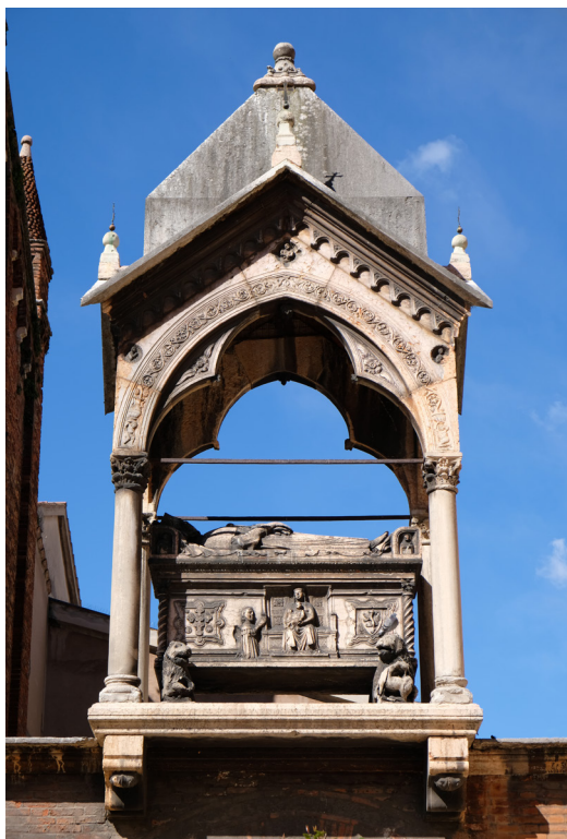
Figura 8. Arca di Guglielmo “il Grande” di Castelbarco († 1320) presso la chiesa di Santa Anastasia a Verona.

Di tutt'altra tradizione sono i monumenti sepolcrali riferibili, fra XIV e XV secolo, alle tre signorie trentine più meridionali. Per i Lodron, strettamente legati alla città di Brescia, nella chiesa di San Francesco d'Assisi di quella città si conserva così una lapide stemmata di fine Quattrocento, schiettamente lombarda nell'impostazione dello scudo e nei caratteri dell'epigrafe, costituiti difatti da una capitale tonda di tradizione umanistica. Discorso analogo per la lastra tombale di Filippa d'Arco, moglie di Baldassarre Thun († 1516), risalente al 1493, presso la chiesa di Santa Maria di Bresimo 87 . Ancora più evidenti i caratteri lombardi delle sepolture dei Castelbarco, da sempre legati a doppio filo con Verona. Ciò si manifesta già a partire dall'arca di Guglielmo il Grande († 1320), presso la chiesa di Sant'Anastasia a Verona: alla pari delle arche scaligere, anch'essa è costituita da un sarcofago, un baldacchino e un ritratto ad altorilievo del defunto (figura 8) 88 . Lo stesso vale per le due di Al-