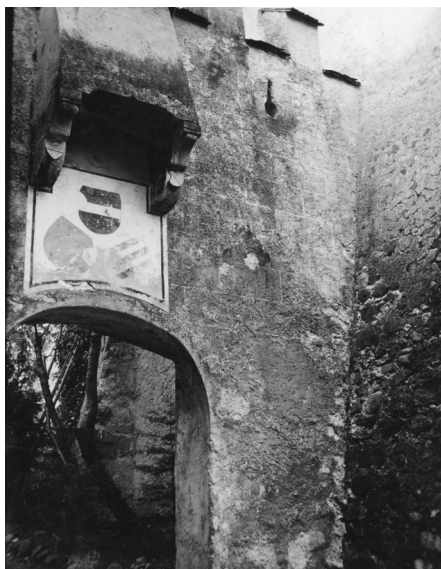
Figura 4. Stemma dei signori di Rottenburg sul portone di ingresso al castello di Castelfondo, prima metà del XIV secolo. Trento, Archivio fotografico storico provinciale, Archivio della Soprintendenza ai Monumenti e alle Gallerie di Trento . © Archivio fotografico storico provinciale, Soprintendenza per i beni culturali PAT.