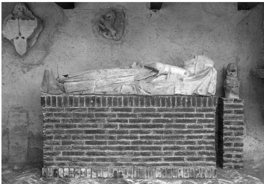
Figura 9. Arca di Guglielmo fu Azzone di Castelbarco-Avio, del 1357 circa. L'arca è conservata a Loppio, presso le collezioni della famiglia Castelbarco, ma proviene dalla chiesa di Sant'Antonio Abate di Sabbionara d'Avio, dovéra originariamente collocata sulla facciata.

drighetto di Castelbarco-Lizzana e di Guglielmo fu Azzone di Castelbarco-Avio, oggi conservate a Loppio, ma originariamente collocate rispettivamente presso la chiesa di San Tommaso a Rovereto e presso quella di Sant'Antonio a Sabbionara (figura 9) 89 .