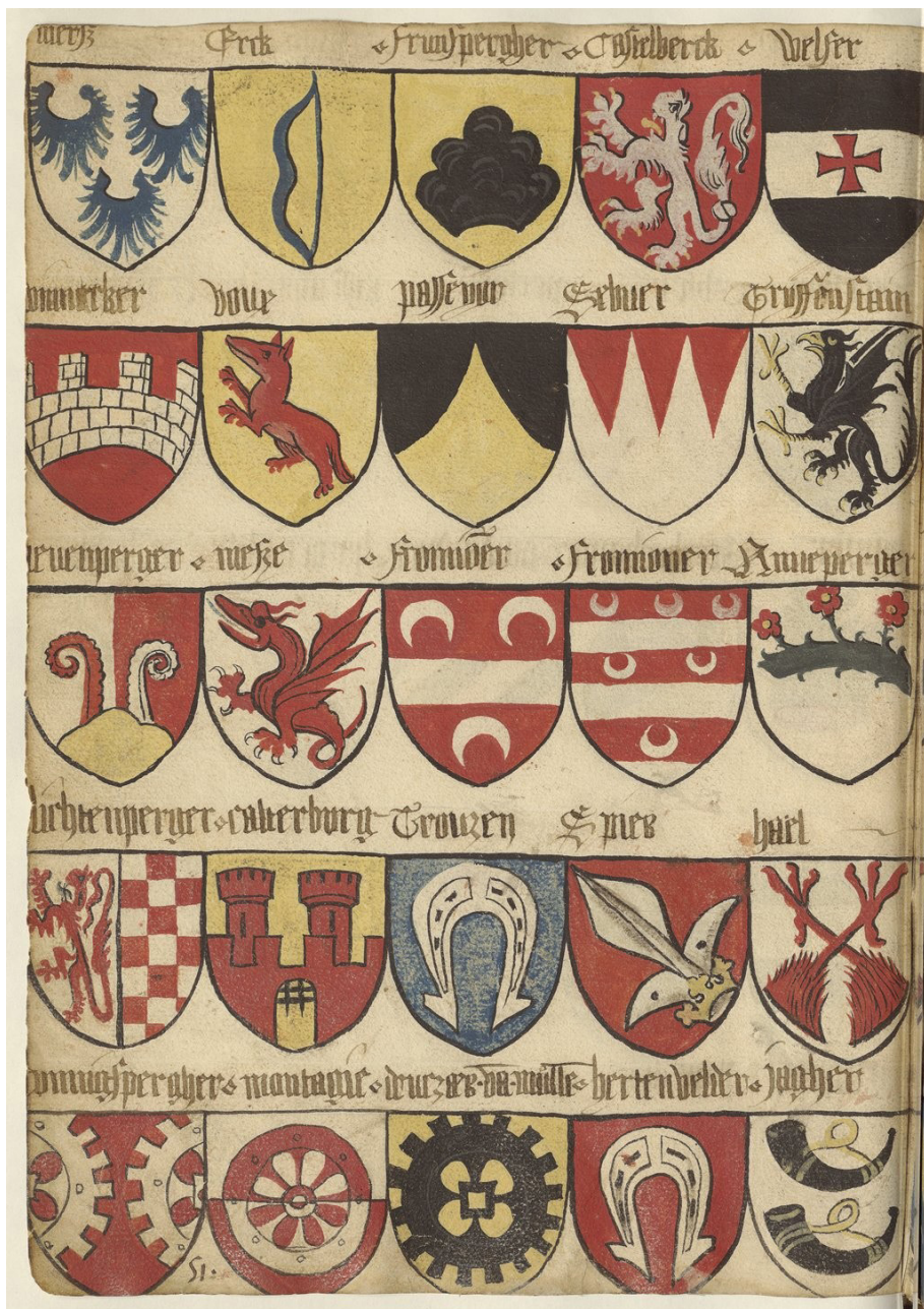
Figura 14. Grand Armorial de la Toison d'Or , del 1430-61. La pagina qui riprodotta presenta una serie di stemmi di famiglie trentino-tirolesi soggette al potere di comando del duca Federico IV d'Austria (o di suo figlio Sigismondo). Paris, Bibliothèque nationale de France, Bibliothèque de l'Arsenal, ms. 4790, p. 51.