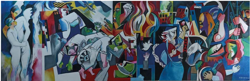
Figura 7 – Hélder Bandarra, La terra è un unico paese , 2022, acrilico su carta in griglia di legno; 6x2 m. © 2022, Hélder Bandarra.

Sassoli / Civilidade è il titolo della magnifica tela di Hélder Carvalho dove la coscienza dell'Altro è evidenziata dal doppio ritratto esibito, riflesso dell'indissociabile antinomia sogno/realtà. C'è quasi come uno spostamento dall'eurocentrismo, che la bandiera tutela, verso la conoscenza degli Altri che «sono lo specchio nel quale ci vediamo riflessi. Per capire meglio se stessi bisogna comprendere meglio gli altri, confrontarsi e misurarsi con essi» (Kapusinski 2007, 14). Questo confronto non è esente da angosce e avversità, palesi anche nell'opzione del co-