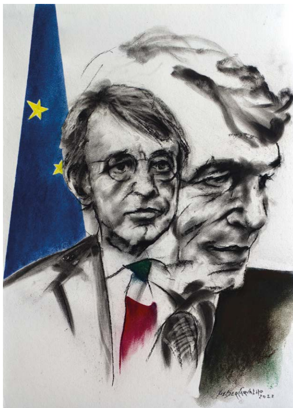
Figura 8 – Helder Carvalho, Sassoli / Civiltà , 2022, tecnica mista su carta (carbone e pastello), 50x70cm. © 2022, Helder Carvalho.

lore porpora della cravatta, ma sorge assertivo e impavido. Soprattutto non nega la credenza del divenire lottando contro la stagnazione, consapevole che «sul nostro pianeta stanno acquistando peso, dinamismo e vita varie civiltà extraeuropee che con sempre maggior determinazione aspirano a sedersi alla tavola rotonda del mondo» (Kapuscinski 2007, 33). L'artista ha capito la lotta di Sassoli per la vera sfida del nostro tempo: «l'incontro con il nuovo altro, altro per razza e per cultura» (Kapuscinski 2007, 75), gestito dal vero incontro con ognuno di noi. L'armonia e serenità delle linee ritratte, evocano gli insegnamenti di Erasmo da Rotterdam in termini educativi ed etici, e suggeriscono gli urgenti e necessari codici morali sui quali si deve reggere la comunità; su questo si sono rivelati sensibili anche Baldassare Castiglione, il nostro Rodrigues Lobo, Machiavelli e Robert Granjon, pionieri della fissazione del termine civiltà che Sassoli ha rispettato, promuovendo l'accettazione e valorizzazione della dignità, diversità e tolleranza, perché rinnovano, proteggono e illuminano. In un totale conferimento, l'artista rincorre il comandamento: Amerai il prossimo come te stesso (Fig. 8).