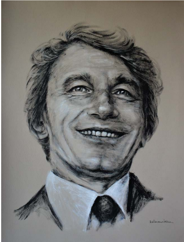
Figura 5 – Do Carmo Vieira, Tributo a David Sassoli , 2022, acrilico su carta Canson 300 gr.; 65x50cm. © 2022, Do Carmo Vieira.

Evoco Leibniz per raccontare della forza, dell'energia e del vigore di MENS AGITAT MOLEM di Fernando Hilário, non in un senso assolutamente materiale, ma in quello in cui le forze centripete convocano l'unità di un'azione per la rappresentazione. Attraverso di essa vedo lo sforzo della richiesta di una coscienza che tasti l'infinito e la perfezione, sottraendosi alla confusione e all'oscurità per, lentamente e in un tira e molla, configurare quello che lo stesso Leibniz definisce appercezione. È così che il suo punto di vista individuale trasmette i diversi e pe-