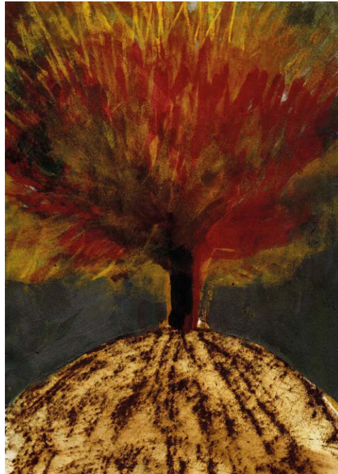
Figura 9 – José Rosinhas, Albero in costruzione , 2022, ArtGraf Tailor Shape su carta; 29,7x21 cm. © 2022, José Rosinhas.