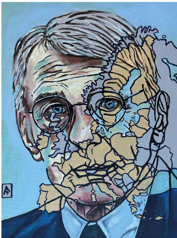
Figura 4 – Afonso Pinhão Ferreira, David Sassoli ha creduto. E noi? , 2022, acrilico su tela, 34,5x44,5 cm. © 2022, Afonso Pinhão Ferreira.

Esimia ritrattista, Do Carmo Vieira afferma di essersi ispirata a dichiarazioni della stampa per elaborare il ritratto di Sassoli. Frasi come: «una personalità calorosa, autentica, sorridente»; «un uomo di rara bontà, il cui sorriso, la visione e le idee erano sufficientemente ampie per un continente»; «amicizia e un comportamento esemplare» (Letta 2021, traduzione nostra) hanno fatto parte della genesi creativa di questo Tributo a David Sassoli . Il genere ritrattistico è, forse, quello che più ha la capacità di tradurre i valori sociali, individuali e culturali; dando la possibilità di recuperare la storia, concilia la dinamica tra l'artista, il mecenate e l'opera d'arte che hanno determinato il suo significato creando il «triangolo di coinvolgimento» a cui allude Michael Baxandall. L'espressione visiva dell'autopercezione di qualcuno, dei suoi valori e delle sue ambizioni, anche se sfaldata dalla soggettività dell'artista, dà la nozione della sua notorietà. L'enigma sta nell'interpretare i vari elementi che lo compongono. Qui e adesso l'ampiezza del sorriso, lo sguardo brillante e accondiscendente, la naturalezza dei