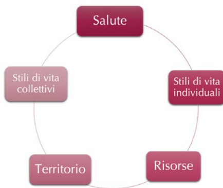
Figura 1 – Sfere in gioco.

Nello scenario specifico del gioco d'azzardo, le principali sfere chiamate ad interagire tutelando le condizioni di benessere psicofisico, supportando eventuali capacità di ripresa, promuovendo maggiori opportunità di accesso a sostegni specializzati e aderenza alle cure proposte, sono cinque: oltre a quelle già richiamate della salute e delle risorse, troviamo le sfere degli stili di vita individuali, degli stili di vita collettivi e del territorio.