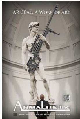
Figura 3 – La campagna pubblicitaria dell’azienda ArmaLite Inc.

Nel 2014, il David di Michelangelo è stato protagonista di un acceso dibattito a causa di un controverso utilizzo dell’immagine da parte di ArmaLite, azienda americana produttrice di armi. L’azienda aveva infatti utilizzato l’immagine del David in una campagna pubblicitaria per promuovere un fucile AR-50A1, facendo apparire il David con un’arma in mano.