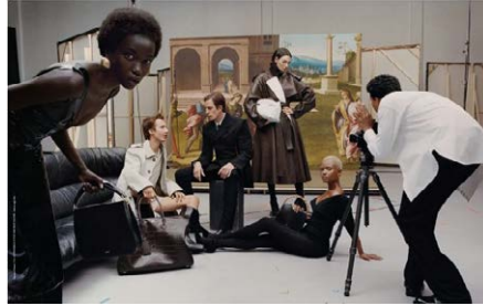
Figura 2 – La campagna pubblicitaria “New Renaissance” dell’azienda Ferragamo.

piccola iscrizione sul fianco delle immagini, quasi impercettibile, reca il nome dell'artista, l'anno e la dicitura «by permission of Ministry of Culture – Gallerie degli Uffizi» (Solfrizzi 2023).