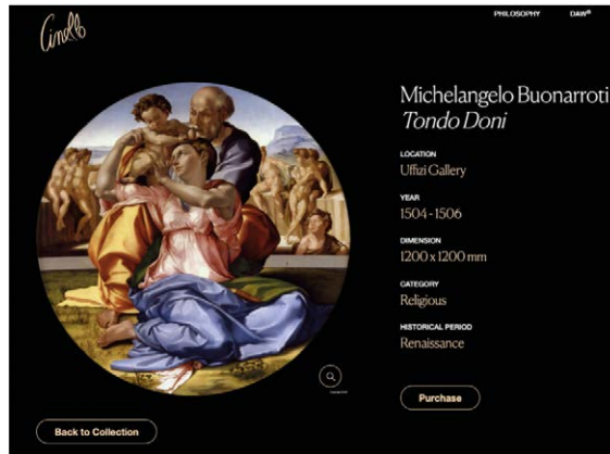
Figura 5 – Il Digital Art Work del Tondo Doni di Michelangelo commercializzato dall’azienda Cinello.

di valore artistico, creati con tecnologie ad alta risoluzione e protetti da un sistema di crittografia avanzato.