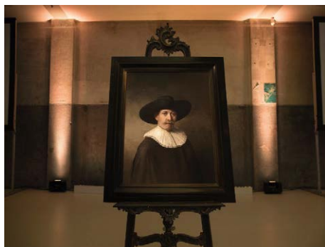
Figura 6 – Il “Next Rembrandt” esposto alla Galleria Looiersgracht 60 di Amsterdam.

Il processo creativo ha portato alla realizzazione di un ritratto immaginario, concepito attraverso modelli statistici che riflettevano le ricorrenze tematiche delle opere originali. Il soggetto scelto, un uomo caucasico di mezza età in abiti seicenteschi, è un classico dei ritratti realizzati da Rembrandt.