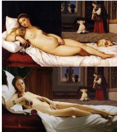
Figura 4 – La campagna “Classic Nudes” lanciata da PornHub in raffronto con l’originale Venere di Urbino di Tiziano.

In entrambi i casi, le istituzioni preposte alla tutela dei beni hanno ritenuto che tali usi delle immagini dei beni non fossero congrui e hanno pertanto agito di conseguenza. Il Codice dei beni culturali dispone effettivamente, all’art. 20, che i beni culturali non possano essere «adibiti ad usi non compatibili con il loro carattere storico o artistico» e tale valutazione di compatibilità non può che essere rimessa alle soprintendenze competenti. E tuttavia occorre precisare che il Codice fa riferimento al bene nella sua «realità», al corpus mechanicum , essendo confinata la disciplina della riproduzione degli stessi beni agli art. 107 e 108 del Codice. Questi ultimi riconoscono un potere in capo al soprintendente di consentire la riproduzione del bene (dunque postulando una ponderazione e l’esercizio di discrezionalità tecnica), ma non forniscono indirizzi sulle modalità di esercizio di questo potere 10 .