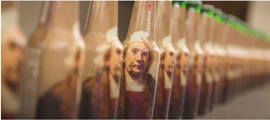
Figura 3 – Le opere della collezione del Rijksmuseum sulle bottiglie di una nota ditta produttrice di birre. © Rijksmuseum, Amsterdam.

danno erariale per una forma d'uso dell'immagine che in ogni caso, nella logica di chi si è costituito in giudizio, non avrebbe mai dovuto essere autorizzata 44 .