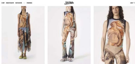
Figura 1 – La collezione Capsule pret-à-porter “Le Musée” dello stilista francese Jean Paul Gaultier.

Ad aprile 2022 la Venere del Botticelli è stata utilizzata su alcuni capi della Capsule pret-à-porter "Le Musée" dello stilista francese Jean Paul Gaultier.