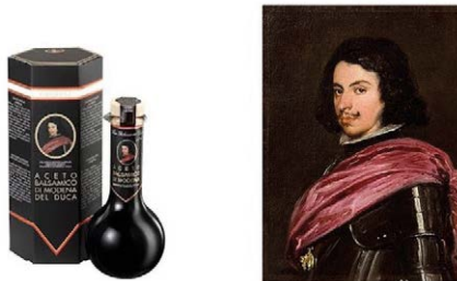
Figura 7 – La confezione dell'“Aceto balsamico di Modena del Duca” con l'immagine del Duca Francesco I d'Este di Velázquez custodito presso la Galleria Estense.

Il caso più recente riguarda l'uso dell'immagine Duca Francesco I d'Este di Velázquez del 1638/1639, custodito presso la Galleria Estense, sulla confezione di un aceto balsamico da parte di una società che nel 1986 aveva finanziato il restauro dell'opera e poi però non aveva ottenuto formale assenso alla riproduzione dell'immagine, né aveva mai versato corrispettivi per la riproduzione.