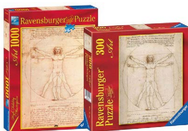
Figura 9 – Il Puzzle dell'Uomo Vitruviano di Leonardo realizzato dall'azienda Ravensburger.

Altro fronte problematico, collegato alla dimensione digitale ma non solo, è quello del rispetto del principio di territorialità. Com'è noto, le disposizioni del Codice dei beni culturali trovano applicazione sul territorio italiano. Emblematico è il caso Ravensburger. La società tedesca ha utilizzato di recente l'immagine dell' Uomo Vitruviano di Leonardo per due versioni di puzzle. Non ha richiesto autorizzazione alcuna né versato il corrispettivo.