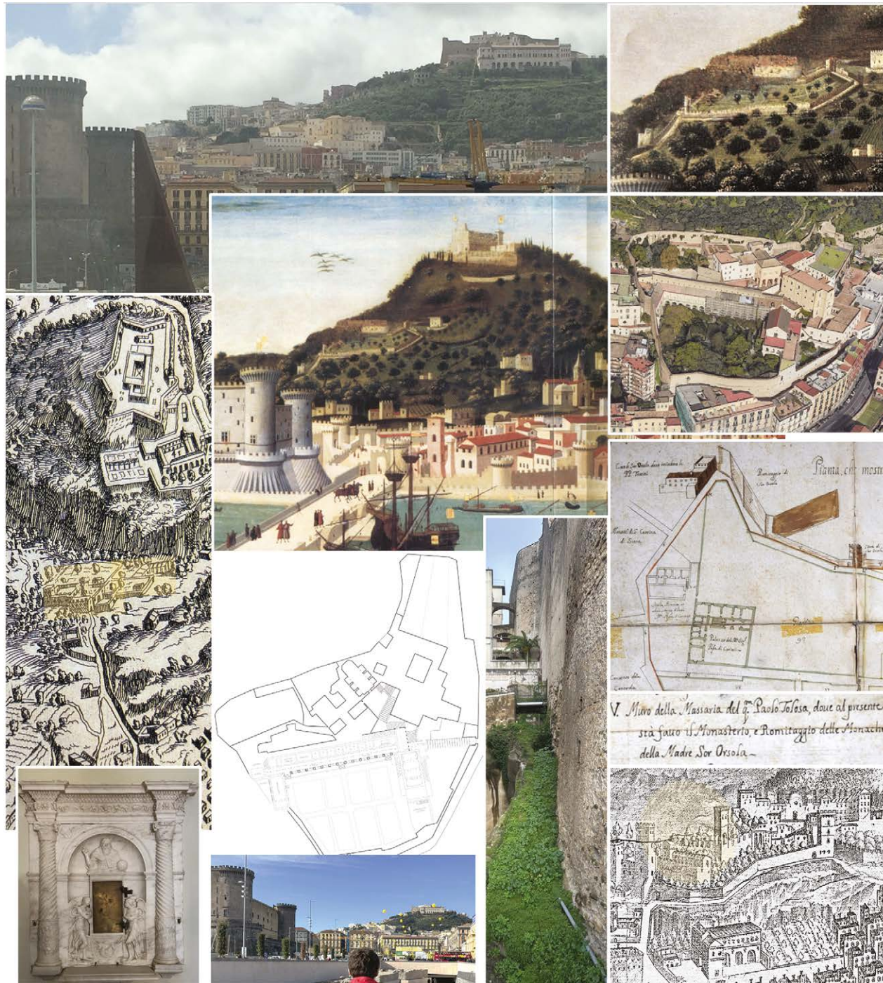
Fig. 4. Studi per la villa di Paolo Tolosa. Da sinistra e dall'alto: Foto attuale della cittadella di Suor Orsola tra Castel Nuovo e Sant'Elmo dalla Stazione Marittima (fotografia di Maria Teresa Como, 2024); Étienne Dupérac, Antoine Lafréry, Quale et di quanta Importanza, e Bellezza sia la Nobile Cita di Napole , 1566 (in Di Mauro 1992b). Particolare con la villa di Paolo Tolosa; Tabernacolo marmoreo del XV secolo ad uso di comunichino nella chiesa dell'Immacolata antica di Orsola Benincasa (fotografia di Maria Teresa Como, 2024); Tavola Strozzi (Museo di San Martino, Napoli, in Di Mauro 1992a); Planimetria della cittadella monastica di Orsola Benincasa con in dettaglio l'Eremo (da Como 2020, p. 118); Foto attuali della cittadella di Suor Orsola tra Castel Nuovo e Sant'Elmo dal molo antico e del tratto sud ovest del muro di cinta della cittadella (fotografia di Maria Teresa Como, 2024); dettaglio della villa di Filippo Strozzi nella Tavola Strozzi (Museo di San Martino, Napoli, in Di Mauro 1992a); vista satellitare 3D della cittadella di Orsola Benincasa (© Google Maps); Pianta che mostra tuti li Quartieri da sopra Strada di Toledo sino alle mura di Sor Orsola dove sono situati li censi, che si possiede dal' Ill.mo sig. Principe di Cariati , Antonio Galluccio Tabulario. Stralcio e relativa legenda, con il dettaglio dell'alto muro di cinta della villa di Paolo Tolosa - Monastero di Orsola Benincasa (in Colletta 1985, pp. 34-35); Alessandro Baratta, Fidelissimae urbis Neapolitanae cum omnibus viis accurata et nova delineatio , 1629 (© Bibliothèque nationale de France). Particolare con la Congregazione di Orsola Benincasa prima della costruzione dell'Eremo che mostra la villa del principe di Forino, erede di Annibale Caracciolo vescovo dell'Isola.