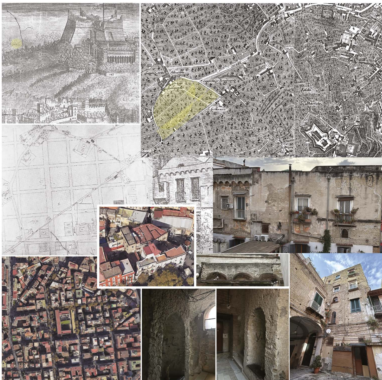
Fig. 3. Studi per la villa di Pontano. Da sinistra e dall'alto: Alessandro Baratta, Fidelissimae urbis Neapolitanae cum omnibus viis accurata et nova delineatio , 1629 (© Bibliothèque nationale de France). Particolare; Pianta Geometrica di un territorio arbustato e fruttato appartenuto alla eredità del fu D. Antonio De Simone sito ad Antignano (in Castanò, Cirillo 2012, p. 26); vista satellitare del fondo (© Google Maps); Giovanni Carafa duca di Noja, Mappa topografica della città di Napoli e de' suoi contorni , 1775 (© Biblioteca Nazionale di Napoli). Particolare con il fondo; disegno della facciata posteriore della villa del Pontano a inizio Novecento (in Pèrcopo 1921, p. 5); vista satellitare 3D del corpo edilizio (© Google Maps); fotografie attuali della facciata posteriore da cui può leggersi il corpo principale dalla cornice terminale in archetti su mensole e il terrazzo in adiacenza dalla cornice modanata in piperno, dettaglio degli archetti su mensole in piperno della cornice terminale, della nicchia a esedra allo smonto delle scale al piano nobile, della torre-scale vista dal cortile (fotografie di Maria Teresa Como, 2024).