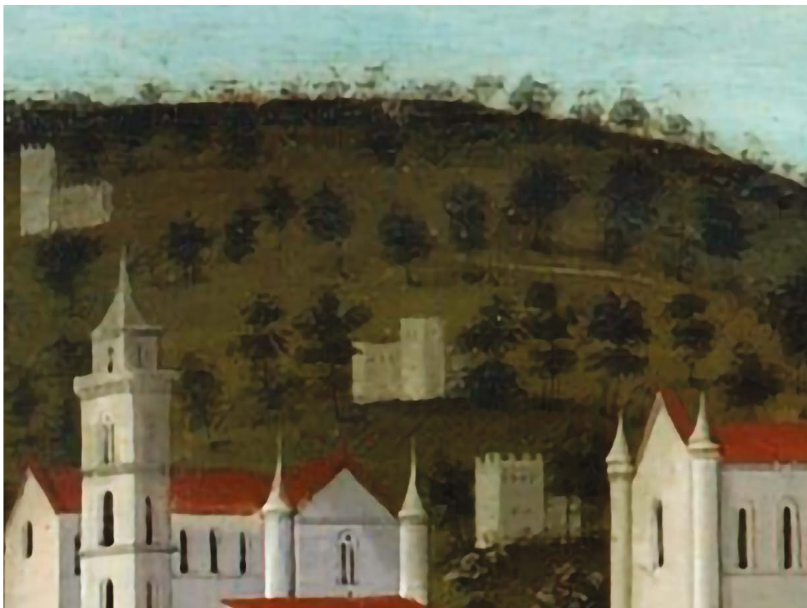
Fig. 2. Francesco Rosselli, Tavola Strozzi (Museo di San Martino, Napoli, in Di Mauro 1992). Particolare della collina della Montagnola con il casino de' Rossi-Gambacorta.