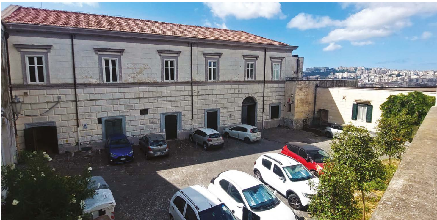
Fig. 7. Veduta del cortile interno della villa, in lontananza la collina di San Martino (fotografia di Simona Landi, 2025).