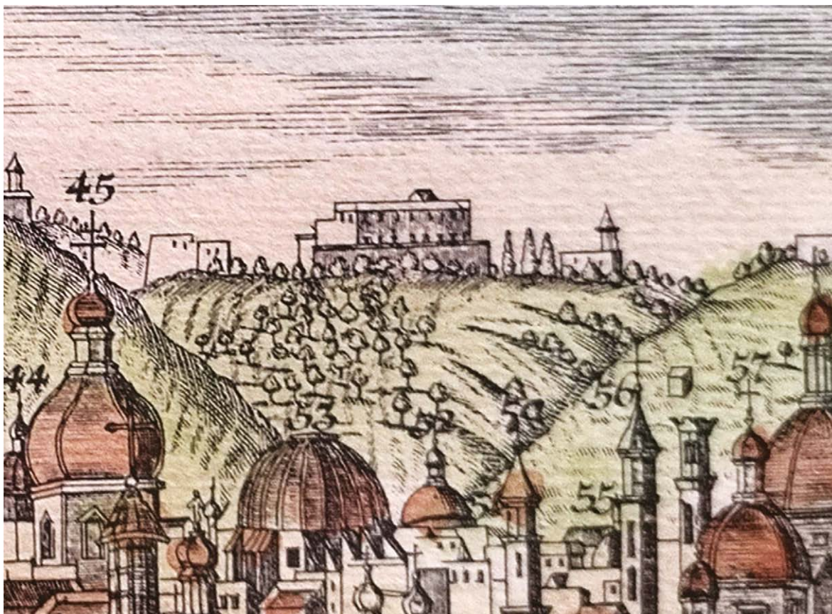
Fig. 5. Anonimo, copia della stampa di Friedrich Bernhard Werner, NEAPOLIS , XX sec. (Collezione privata, Napoli).