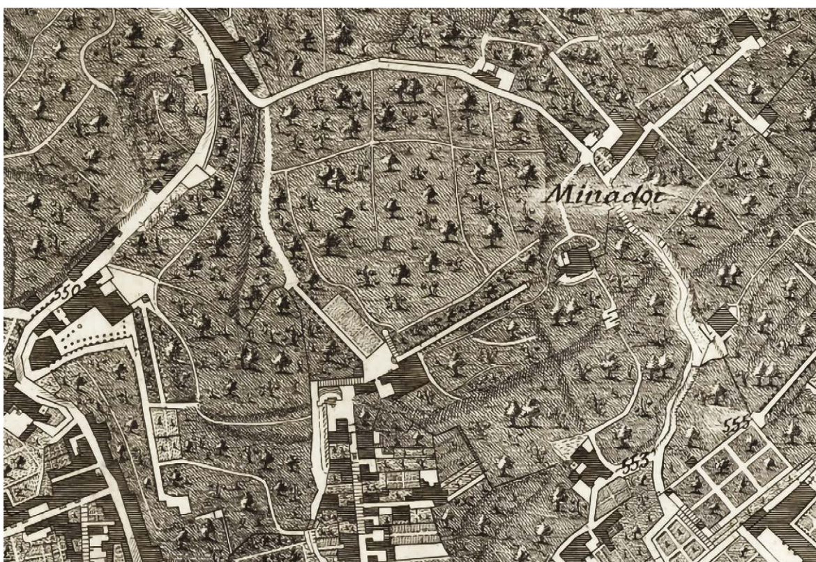
Fig. 6. Giovanni Carafa duca di Noja, Mappa topografica della città di Napoli e de' suoi contorni , 1775.