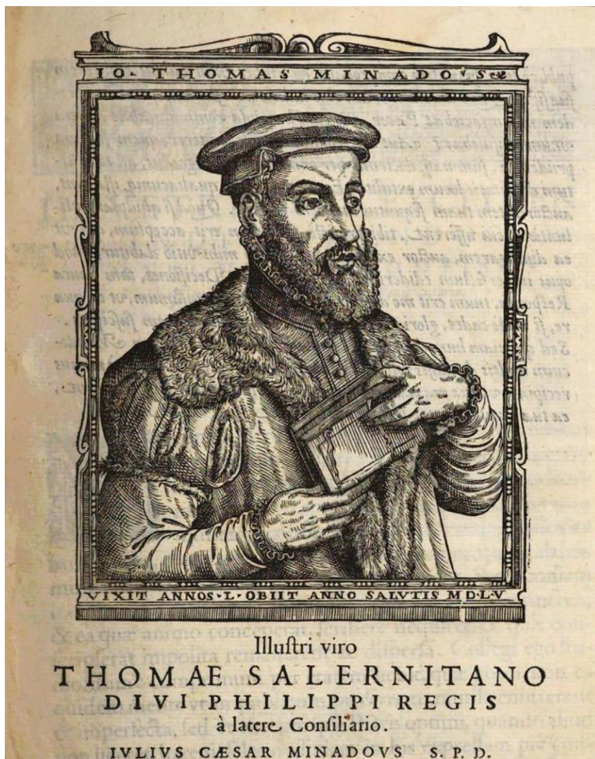
Fig. 1. Ritratto di Giovan Tommaso Minadois (Minadois 1576).

la Montagnola 15 , menzionata in virtù della lite avvenuta tra il Principe di Avellino e Torquato Tasso 16 , per la «ricuperazione dei beni di sua madre» 17 . Come si desume dal testo, la proprietà fu venduta nel 1539 al Minadois da Jacobo Maria de' Rossi, figlio di Giovanni de' Rossi – o Giacomo, secondo il Manso 18 – noto mercante pisano 19 , e Lucrezia Gambacorta, discendente di Gherardo Gambacorta 20 , nonni materni del Tasso e proprietari della villa dalla seconda metà del Quattrocento.