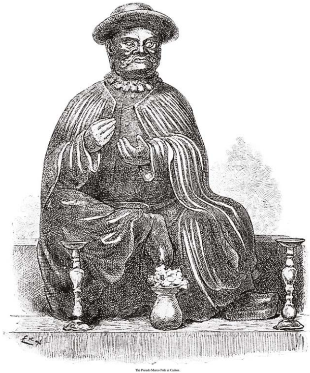
Figura 6.4 – Pseudo-statua di Marco Polo in Yule and Cordier 1921, III, 78-9.

La questione assunse un certo rilievo poi quando un disegno a china della statua fu inserito come illustrazione nella terza edizione della già citata opera di Yule, The Book of Ser Marco Polo (fra le pagine 78 e 79), del 1903 curata da Cordier, con la seguente didascalia «The Pseudo Marco Polo at Canton», ma senza alcun ulteriore riferimento nel corpo del testo (Fig. 6.4).