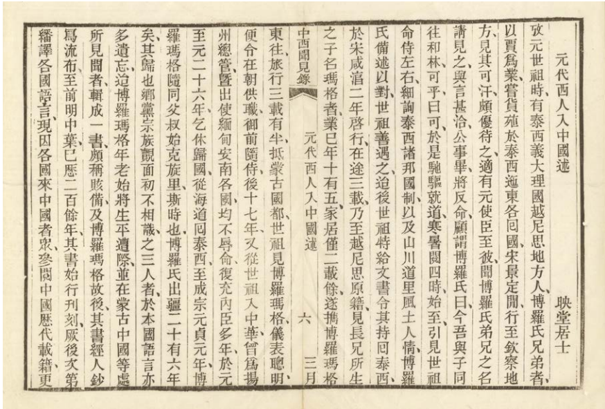
Figura 6.1 – Yundai Xiren ru Zhongguo shu 元代西人入中國述, prima pagina.