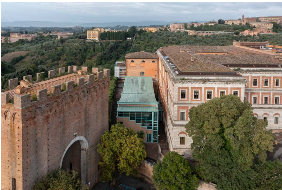
Figura 3.5 • Il padiglione esterno, con in primo piano Porta Romana.