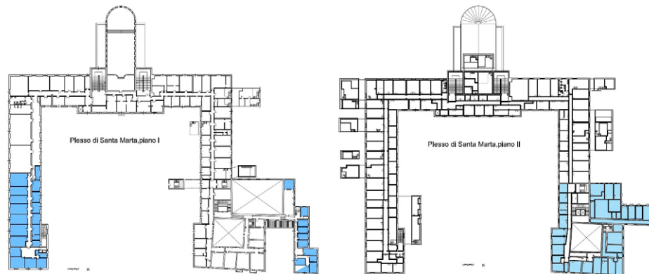
Figura 8 – Uffici occupati dai Dipartimenti di Meccanica e Tecnologie Industriali e dal Dipartimento di Energetica nel 1998.

Il Dipartimento di Energetica, dopo il Prof. Martelli, fu diretto dal 1987 da Sergio Stecco, alla cui memoria, dopo la sua prematura scomparsa, viene intitolato il dipartimento stesso. A lui succedettero dal 1992 Ferruccio Fontanella e dal 1998 Paolo Dapporto. Entrambi i Dipartimenti avevano sede operativa presso il plesso di Santa Marta; il DMTI occupò prevalentemente gli spazi del primo piano dell'ala sinistra del plesso, il DE il secondo piano dell'ala destra (Figura 8).