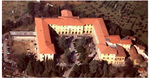
Figura 5 – Plesso di Santa Marta, sede principale dell'attuale Scuola di Ingegneria.