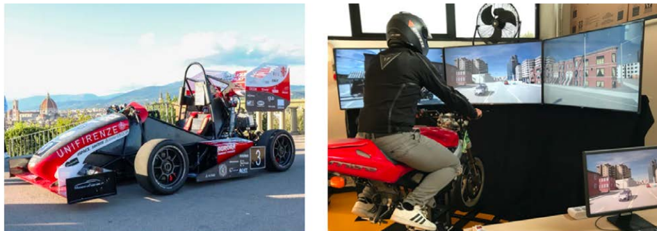
Figura 15 – A sinistra, prototipo formula SAE sviluppato da V2D Lab; a destra, simulatore di guida sede di sperimentazioni da parte del Laboratorio MOVING.