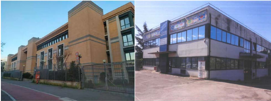
Figura 12 – Plesso di Viale Morgagni (a sinistra), Plesso di Calenzano (a destra).

L'estrema vivacità e valore dell'operato del Dief è testimoniata dalla raccolta di fondi esterni quantificata con un budget di circa 8 milioni di euro all'anno, suddivisi tra un 60% di progetti di ricerca competitivi internazionali e nazionali e un 40% di contratti di ricerca. Il rapporto tra il budget e il numero di professori e ricercatori facenti parte dello staff permanente si aggira sui 135.000 euro annui per ricercatore ponendo senza dubbio il Dief ad un livello di eccellenza europeo e in prima posizione a livello di Ateneo. Alcune delle tematiche applicative in cui il Dief è più attivo sono Turbomacchine e Macchine Volumetriche, Aerodinamica e Aeroelasticità, Motori Aeronautici e Motori a Combustione Interna in genere, Veicoli Stradali a 2 e 4 ruote, Veicoli Ferroviari, Nanotecnologie, Bioingegneria, Robotica Riabilitativa e Assistiva, Robotica Subacquea, Tecnologie per Industria 4.0, inclusa la Stampa 3D, Tecnologie per l'Ambiente e Tecnologie per l'Industria della Moda.