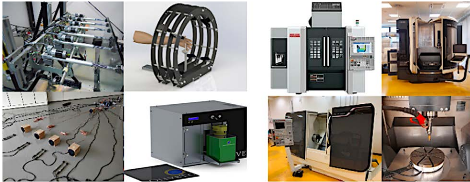
Figura 14 – A sinistra, alcuni dei sistemi sviluppati dal Laboratorio SMIPP; a destra, alcune delle macchine disponibili presso MTRL.