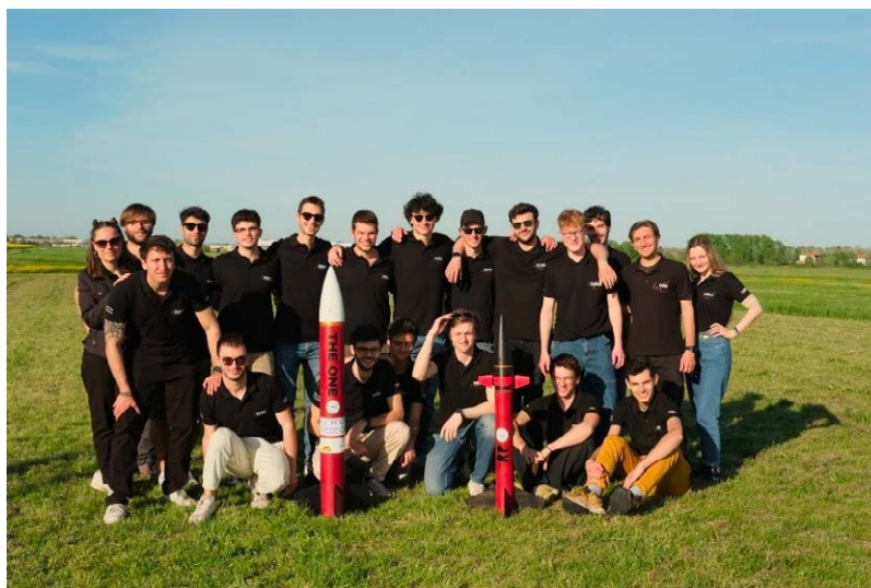
Figura 153 – Il Team di Red Propulsion nel 2024.

Oggi, più determinati che mai, i membri del team Red Propulsion guardano con entusiasmo alla loro prossima sfida: la partecipazione all'European Rocketry Challenge, prestigiosa competizione internazionale che vedrà protagonista il terzo razzo a propellente solido attualmente in fase di sviluppo: RED ASTER. Dopo aver portato a termine con successo la progettazione dei primi due vettori – RED GOBLIN, con un impulso totale di 613 Ns, e RED ONE, con 1395 Ns – il team è pronto a entrare nella fase di costruzione e test dei propri prototipi. Grazie agli spazi dedicati e ai fondi messi a disposizione dal laboratorio, è ora possibile dare forma concreta a quanto immaginato e progettato. RED ASTER rappresenta un salto qualitativo importante per la squadra: non solo per la complessità tecnica, ma anche per il valore simbolico del progetto, che si candida a diventare il portabandiera dell'eccellenza fiorentina nel campo dell'ingegneria aerospaziale studentesca. Questo nuovo traguardo segna una tappa fondamentale del percorso di crescita di Red Propulsion, e conferma come il lavoro di squadra, la passione per la ricerca e l'audacia nell'innovazione possano trasformare un'idea in una realtà destinata a lasciare il segno.