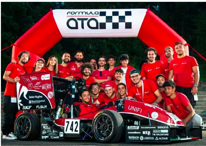
Figura 150 – Firenze Race Team alla Formula ATA del 2024.

Nel 2024, il Firenze Race Team ha partecipato con orgoglio alla prestigiosa competizione Formula SAE Italy, svoltasi presso l'Autodromo di Varano de' Melegari. Un evento che rappresenta uno dei più importanti appuntamenti internazionali per le squadre universitarie di ingegneria, dove si sfidano i migliori talenti accademici nella progettazione e costruzione di vetture da corsa ad alto contenuto tecnologico. La squadra ha affrontato con determinazione tutte le prove previste dalla competizione – tecniche, dinamiche e statiche – mettendo alla prova le soluzioni ingegneristiche sviluppate sulla propria monoposto. Le giornate in pista sono state segnate da momenti di grande intensità, in cui la preparazione, lo spirito di collaborazione e la passione degli studenti hanno brillato nel confronto con oltre 60 squadre universitarie provenienti da tutta Europa e oltre. Il risultato finale – quarto posto assoluto – testimonia la qualità del lavoro svolto, l'alto livello di competenza raggiunto e la capacità del gruppo fiorentino di competere con successo in uno dei contesti più sfidanti del panorama accademico internazionale. Un traguardo che conferma il Firenze Race Team come eccellenza dell'Università di Firenze e simbolo del connubio tra formazione, ricerca applicata e cultura dell'innovazione.