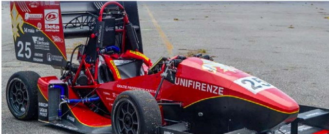
Figura 149 – Vettura FR-25.

terizzata da un avanzato sistema di guida autonoma e da un'attenta ottimizzazione dell'aerodinamica. Il redesign del fondo e delle ali, la rimozione delle pance e l'introduzione di un nuovo sistema di raffreddamento con due masse radianti simmetriche, integrato nelle nuove geometrie, sono solo alcuni degli elementi che ne fanno un gioiello di ingegneria.