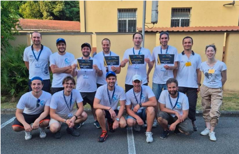
Figura 152 – Foto dell'edizione 2025 della competizione RAMI (Robotics for Asset Maintenance and Inspection).

striale dell'Università di Firenze, e della capacità di tradurre la ricerca in applicazioni avanzate, valorizzando il talento degli studenti e contribuendo all'evoluzione della robotica applicata in ambito marittimo.