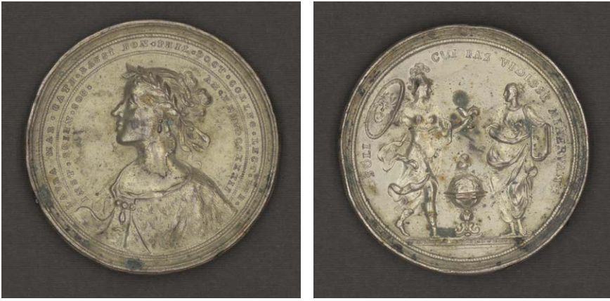
Figura 1 – Medalla de plata acuñada en 1732 con motivo de la primera lección pública de Laura Bassi, con su efigie en el anverso y en el reverso Minerva entregando una lámpara encendida a una joven. Biblioteca dell'Archiginnasio di Bologna.

primera de ellas el 18 de diciembre de 1732), actos entre lo intelectual y lo festivo en los espacios de representación más prestigiosos de Bolonia 4 (Figura 1).