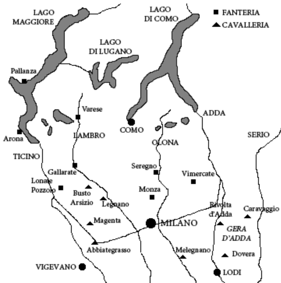
Figura 1: I 'posti di case herme' del Ducato (settembre/ottobre 1652)