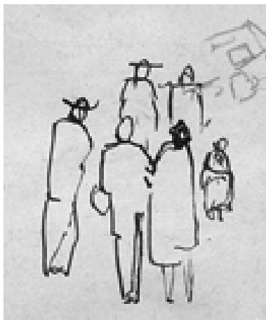
Figura 2: Disegno