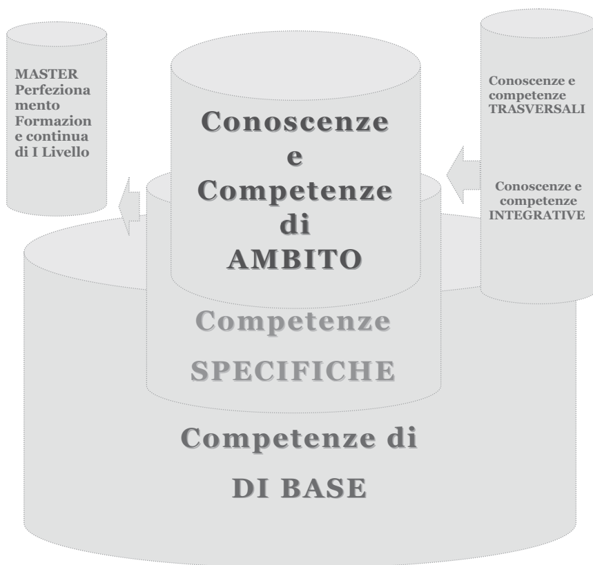
Box 1. Campi e livelli di conoscenze e competenze del Primo Ciclo

L'impaginazione delle competenze dei profili professionali per il riconoscimento farà riferimento a quelle delle classi di laurea, alle quali d'altra parte potranno dare ulteriori indicazioni provenienti dalle esperienze lavorative, pur considerando le differenze tra profilo di laurea, profilo abilitante alla professione e profilo lavorativo.