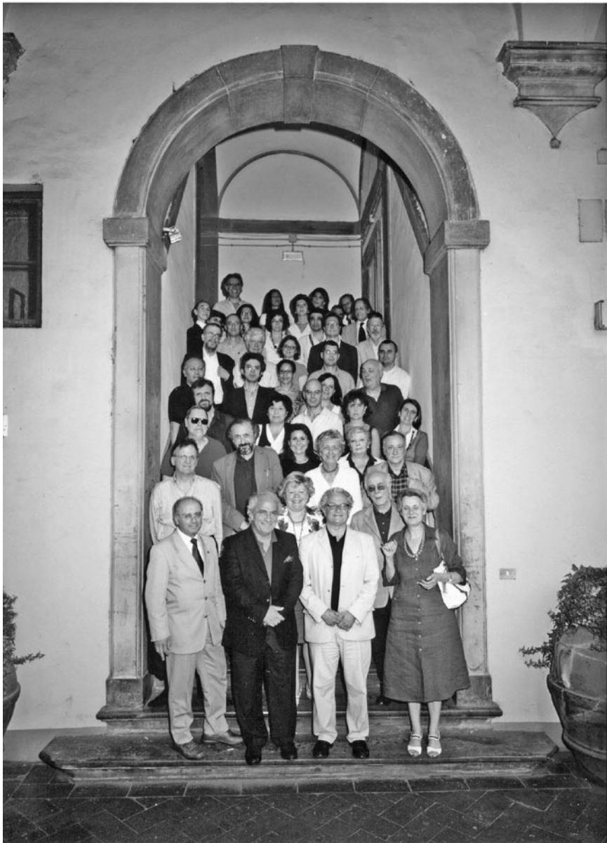
Figura 2. Professori e Ricercatori della Facoltà di Scienze della Formazione dell'Università degli Studi di Firenze. Scalone di ingresso alla Facoltà – Luglio 2009