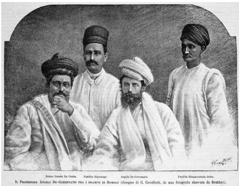
Figura 1 – Ritratto di gruppo composto da José Gerson da Cunha, Angelo De Gubernatis (seduti, da sinistra a destra), Shyamaji Krishnavarma, Bhagwanlal Indraji (in piedi), 1885. Litografia. Disegno di C. Cavallotti realizzato a partire da una fotografia fatta in uno studio di Bombay il 10 ottobre 1885. Pubblicato ne L'Illustrazione Italiana , n. 50 del 13 dicembre 1885, assieme all'articolo «De Gubernatis Brahmino».