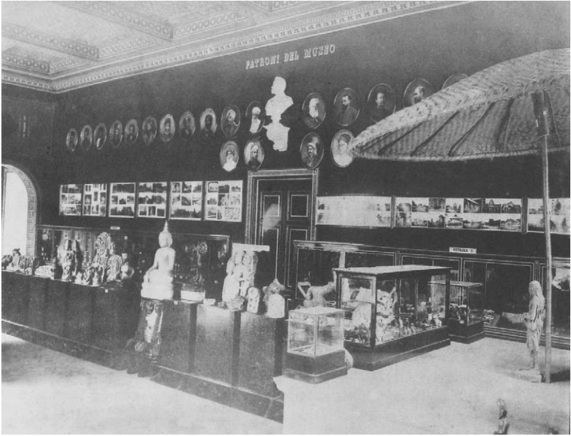
Figura 10 – Museo Indiano, Firenze, c. 1886. Fotografia dell'interno di una delle sale. Precede il frontespizio nel libro di Angelo De Gubernatis, Peregrinazioni Indiane , vol. II, 1887.