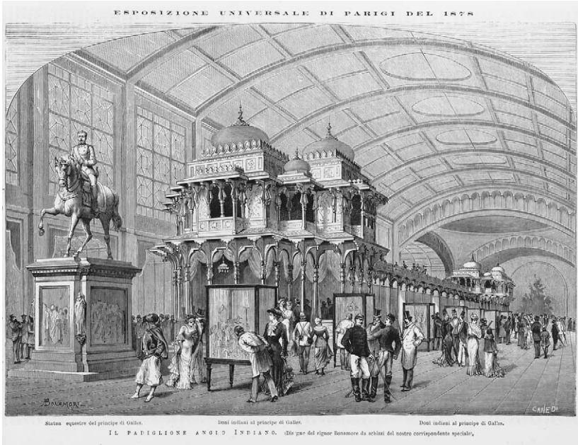
Figura 6 – Esposizione Universale di Parigi del 1878. Litografia. Padiglione anglo-indiano. Doni offerti al Principe di Galles nel corso del suo viaggio in India del 1875. Disegno di Bonamore realizzato a partire dagli schizzi fatti dall'inviato speciale del giornale a Parigi, L'Illustrazione Italiana , n. 36 (8 settembre 1878). L'immagine illustrava un articolo intitolato «La collezione del Principe di Galles».