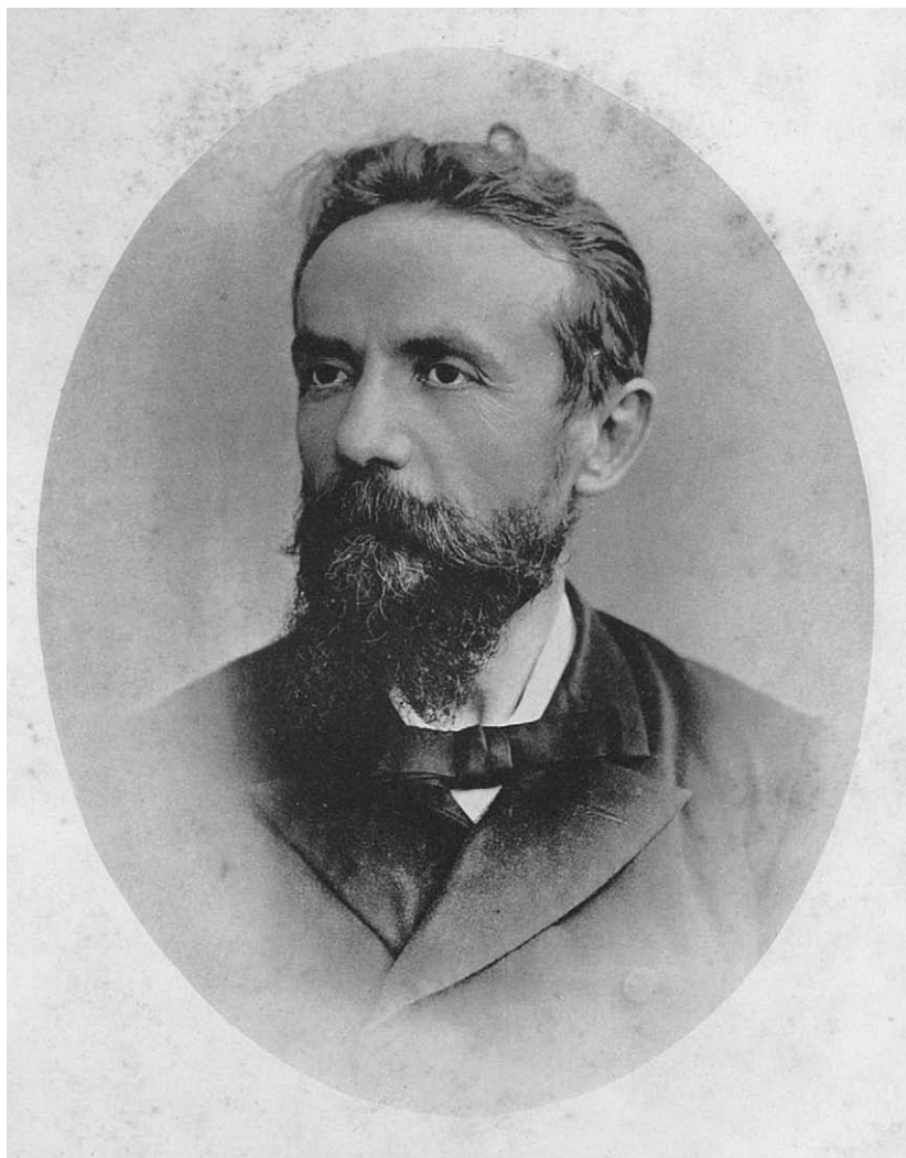
Figura 2 - Angelo De Gubernatis, c. 1886. Precede il frontespizio nel suo libro di viaggi in India, Peregrinazioni Indiane , vol. I, 1886.