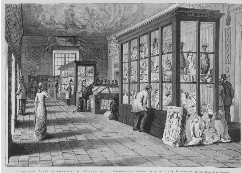
Figure 4 e 5 – Esposizione Orientale, Firenze, 1878. Prima sala (fig. 4) e Sala Luca Giordano (fig. 5), Palazzo Medici Riccardi. Congresso Internazionale degli Orientalisti a Firenze. Disegni di Borroni. Le due litografie illustravano il testo scritto da G. Carocci, «Il Congresso degli Orientalisti a Firenze», L'Illustrazione Italiana , n. 40 (6 ottobre 1878).