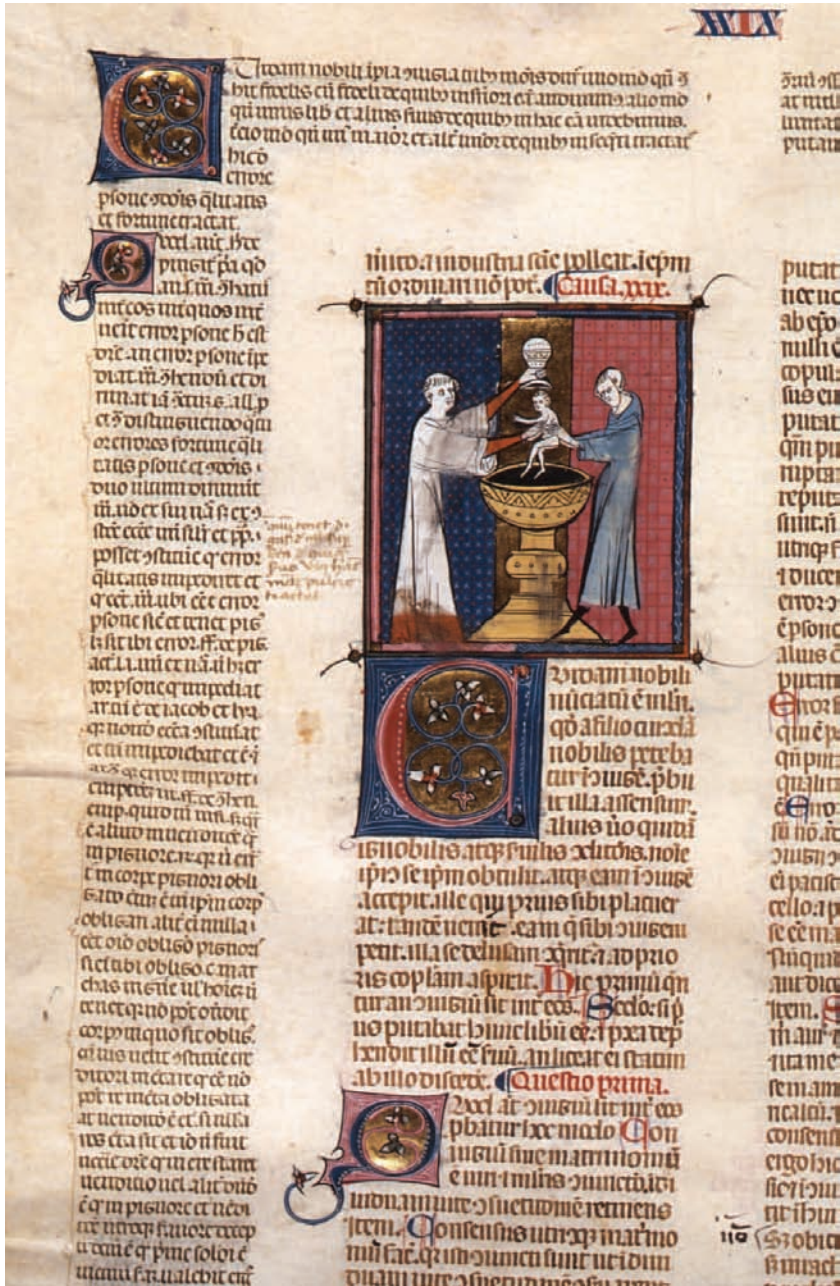
Figura 2. Firenze, Biblioteca Medicea Laurenziana, ms. Edili 97, f. 317v, dettaglio (su concessione del Ministero dei Beni e delle Attività culturali e del Turismo; è vietata ogni ulteriore riproduzione con qualsiasi mezzo).