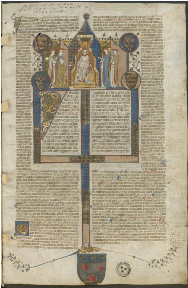
Figura 4. Grenoble, Bibliothèque Municipale, ms 37, f. 1r Rès. (© Bibliothèque Municipale de Grenoble, cliché BMG).