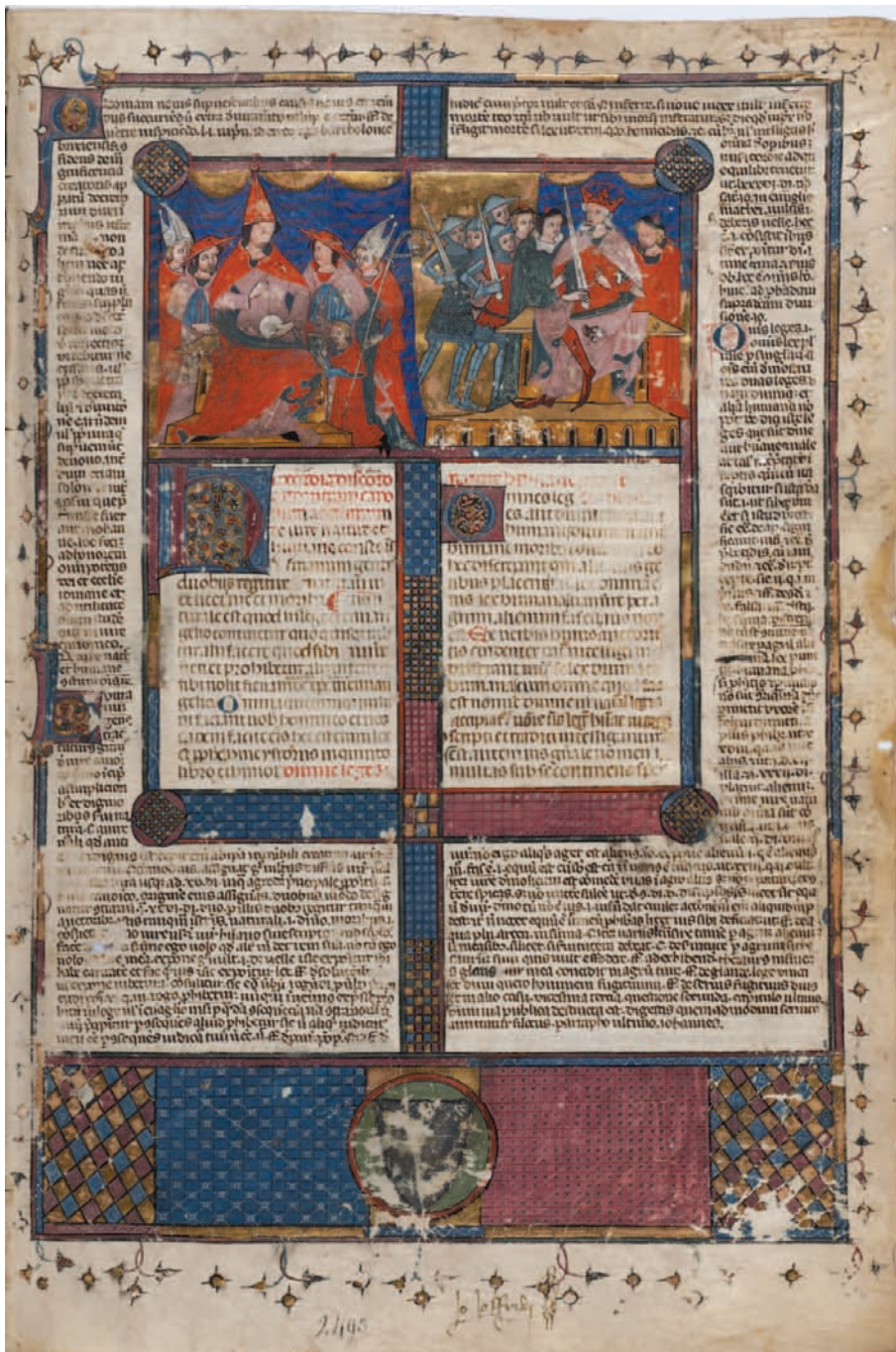
Figura 1. Città del Vaticano, Biblioteca Apostolica Vaticana, Vat. lat. 2493, f. 1r.