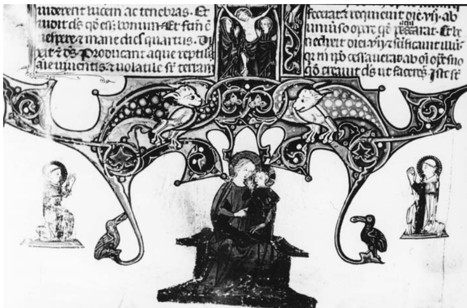
Figura 12. Chartres, Bibliothèque municipale, ms 165 (201), f. 4v.