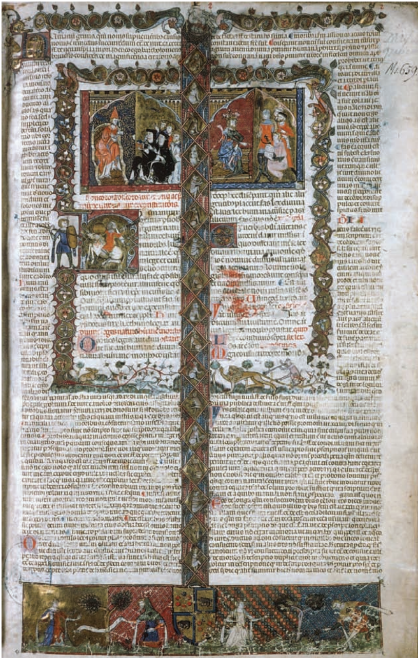
Figura 3. Avignone, Bibliothèque Municipale, ms. 659, f. 2r.