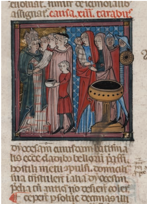
Figura 5. Città del Vaticano, Biblioteca Apostolica Vaticana, Vat. lat. 2493, f. 225v.