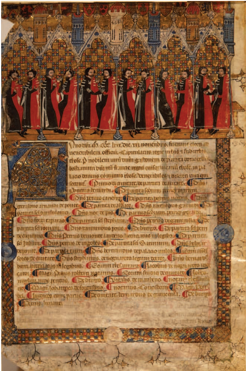
Figura 10. Toulouse, Musée des Augustins, D 1952-6, Les Capitouls de 1369 et de 1370 , enluminure provenant des Annales de Toulouse.