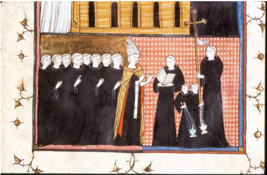
Figura 9. Toulouse, Bibliothèque municipale, ms 91, f. 170r, dettaglio.