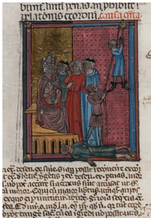
Figura 6. Città del Vaticano, Biblioteca Apostolica Vaticana, Vat. lat. 2493, f. 167r.