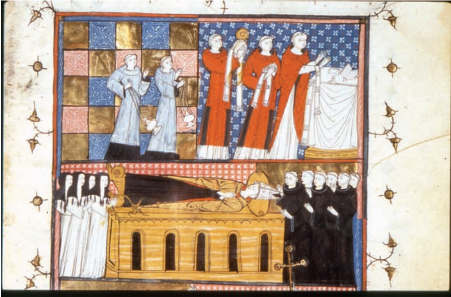
Figura 8. Toulouse, Bibliothèque municipale, ms 91, f. 170r, dettaglio.