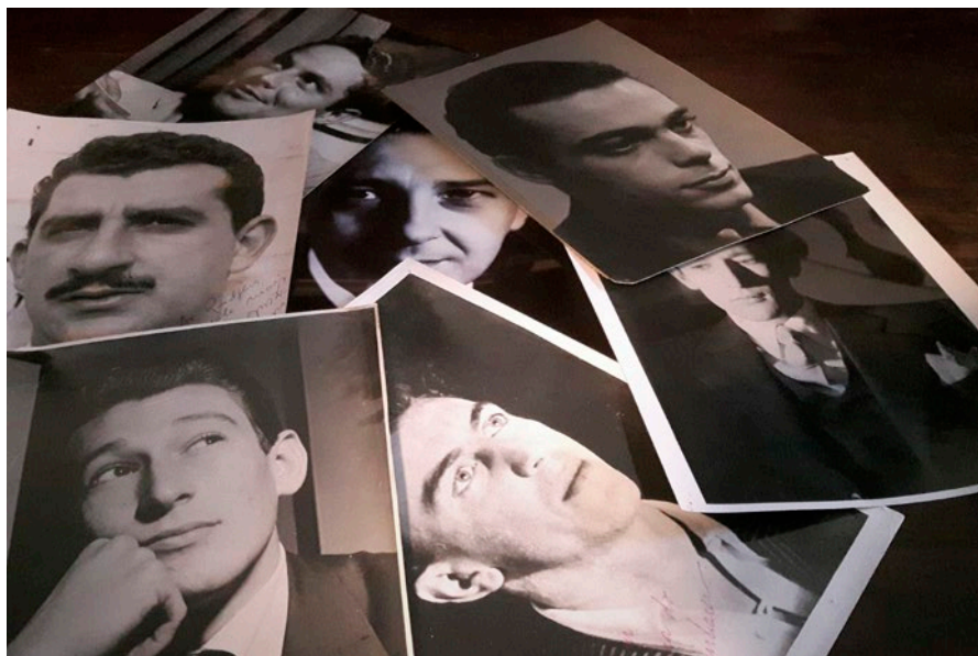
Lontano, dalla notte (© Anna Dolfi).