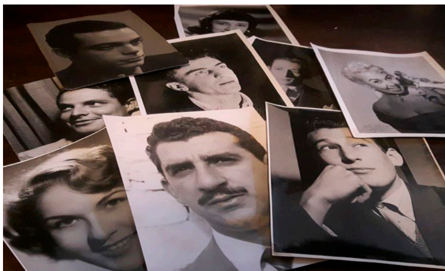
Eco dal passato (© Anna Dolfi).