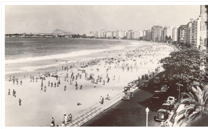
Praia de Copacabana, anni Cinquanta.