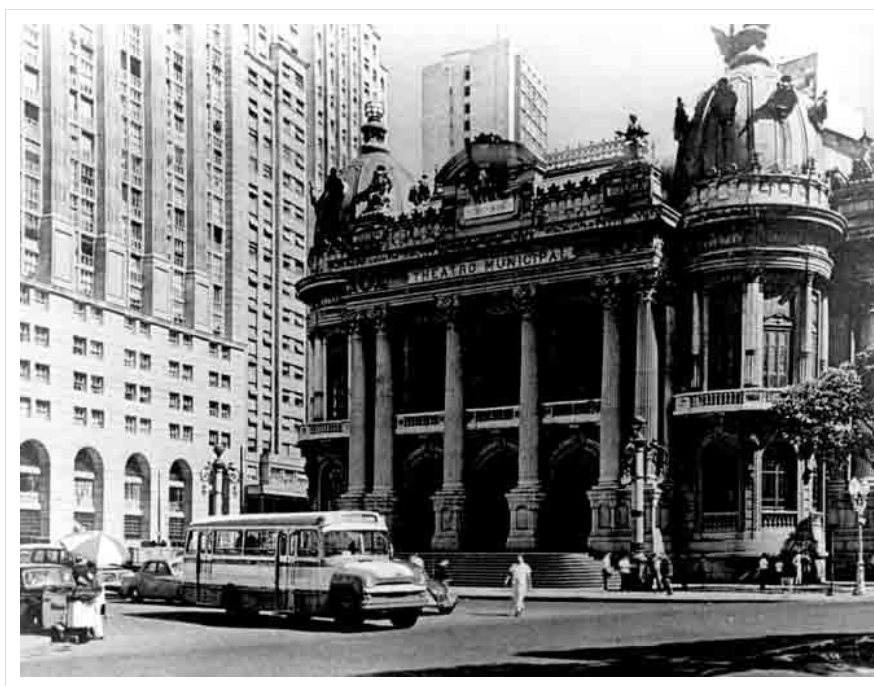
Teatro Municipal, Rio de Janeiro, anni Sessanta.