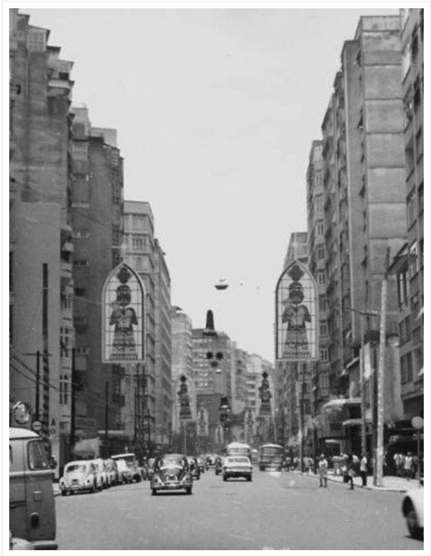
Avenida Nossa Senhora de Copacabana, anni Cinquanta.