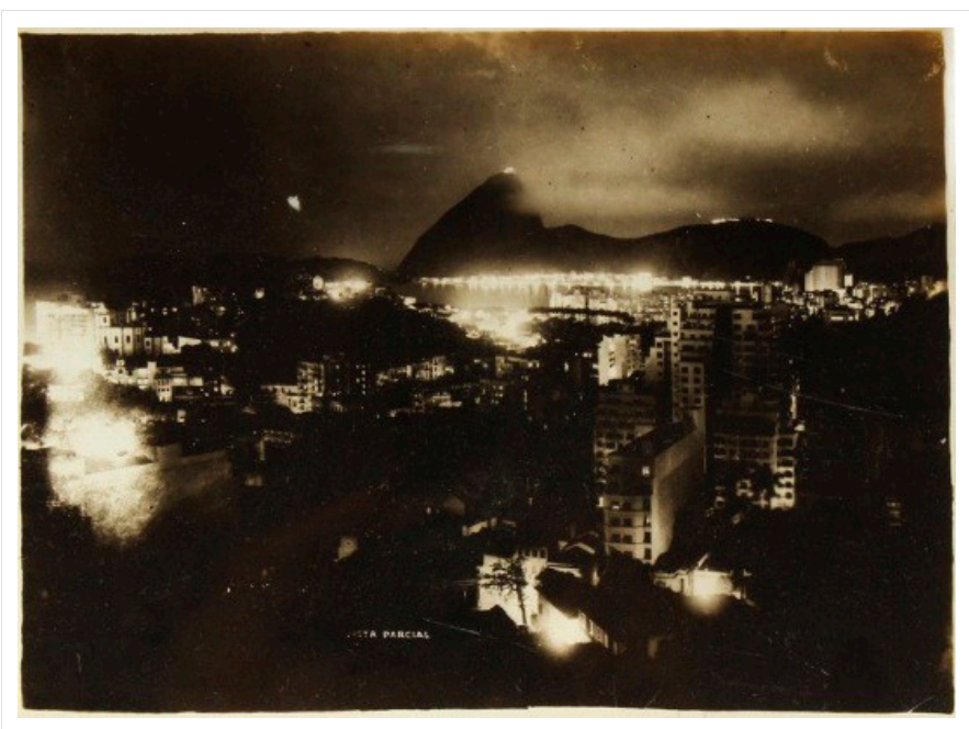
La notte di Copacabana, anni Cinquanta.