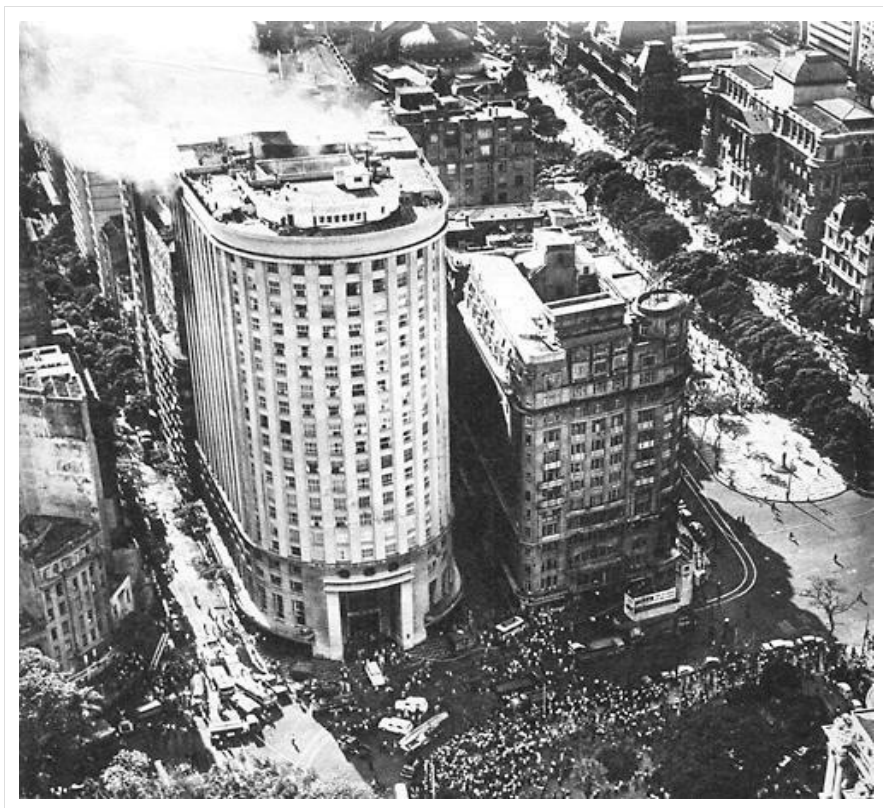
Cinelândia, Rio de Janeiro, anni Sessanta.