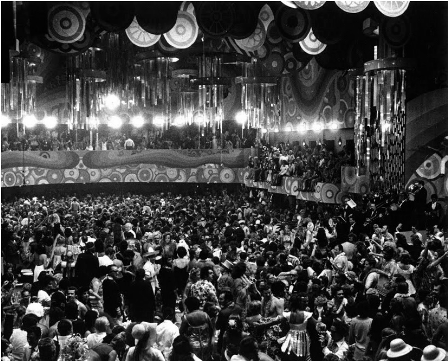
Ballo di gala di Carnevale al Teatro Municipal di Rio de Janeiro (16 febbraio 1972).