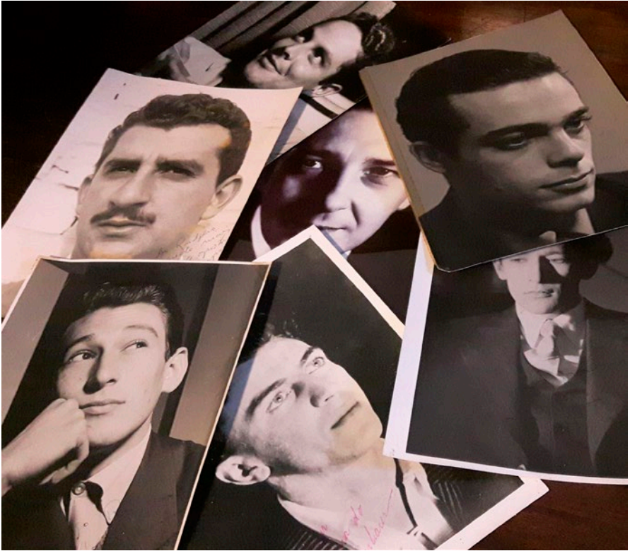
Ruggero, il volto, il doppio.