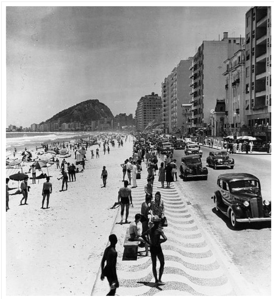
Praia de Copacabana, anni Cinquanta.