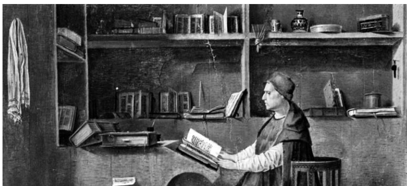
Fig. 2. Confronto. In alto . Antonello da Messina, "San Girolamo nello studio", 1474. Particolare. In basso . Lo studio di casa mia, 10 marzo 2018.