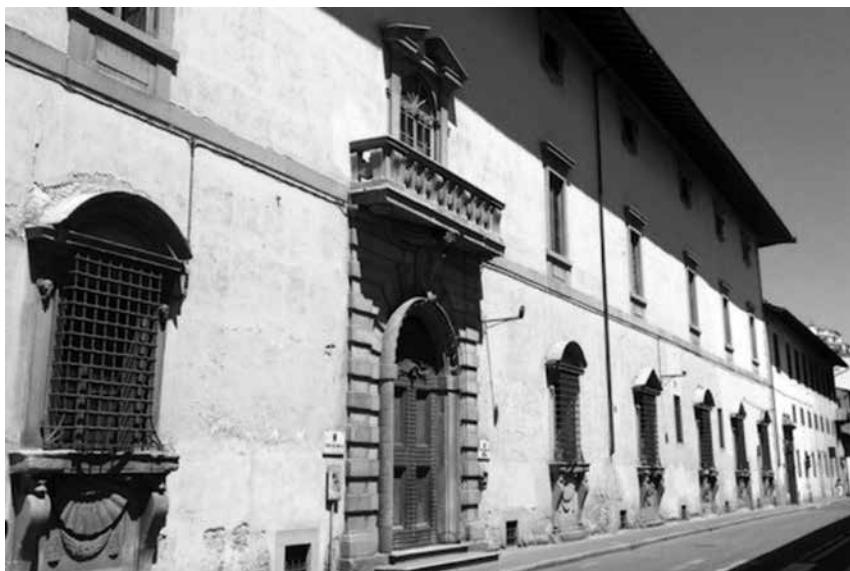
Figura 4 – Ex Corte d'Assise in via Cavour a Firenze.