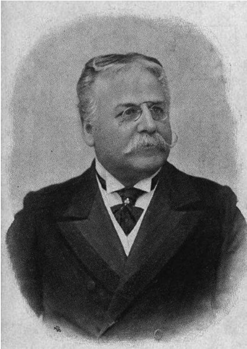
Figura 3 – Raffaele Palizzolo.