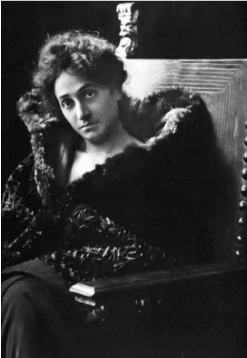
Figura 1 – Anna Franchi nel 1895.