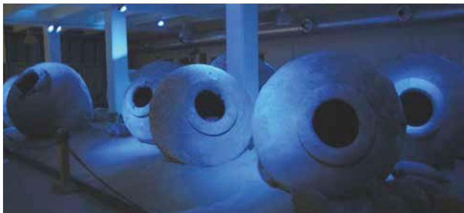
Figura 1 - Museo Navale di Imperia. Sala Nino Lamboglia. Il relitto a dolia del Golfo Dianese.

Leudo del Mercante di Varazze, nel nuovo Museo Navale di Imperia [1, 5 e 8]. Una sezione importante della nuova sala dedicata all'archeologia subacquea di questo museo (Sala Nino Lamboglia) prevede, inoltre, l'esposizione dei reperti frutto delle indagini dell'Operazione Nemo; si tratta di oggetti che provengono dai fondali dell'Imperiese che, grazie alle ricerche successive, è stato possibile ricondurre ai siti di provenienza, permettendoci non solo di arricchire le conoscenze scientifiche sui contesti archeologici, ma anche di comunicare alla cittadinanza il giusto significato e valore degli oggetti illecitamente trafugati.