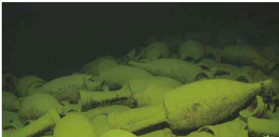
Figure 5 - Particolare del carico del relitto S. Margherita 1. Figure 5 - Picture of the S. Margherita 1 wreck.

La storia della scoperta del relitto di Santa Margherita merita di essere ricordata in questa sede come esempio virtuoso che bene illustra le potenzialità di una corretta collaborazione tra operatori locali e istituzioni. Il 26 maggio del 2016, durante una battuta di pesca ai gamberoni su un fondale di circa 700 metri di profondità, il peschereccio Impavido di Santa Margherita salpava nelle reti 4 anfore romane. Con grande senso civico il comandante Gianni Paccagnella denunciava immediatamente il rinvenimento archeologico al locale Ufficio Circondariale Marittimo. Veniva quindi informata la competente Soprintendenza che, a seguito di una prima analisi dei reperti, disponeva la custodia delle anfore presso i laboratori dell'Area Marina Protetta di Portofino, al fine di provvedere alle necessarie e preliminari operazioni conservative. Considerando inoltre le difficoltà di affrontare la ricerca del relitto sulla scorta delle informazioni desunte dal percorso di pesca dell' Impavido , un tracciato GPS lungo una decina di miglia, la Soprintendenza contattava l'ing. Guido Gay, che nel settembre dello stesso anno riusciva a localizzare e a documentare il relitto (fig. 5).