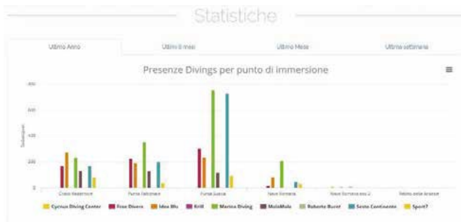
Figura 3 - Prospetto statistico delle immersioni svolte suddiviso per i diversi soggetti autorizzati.

Grazie a questo programma di valorizzazione la Soprintendenza ha avuto la possibilità di intraprendere, grazie al supporto dei diving locali e dei Carabinieri, indagini conoscitive sui contesti archeologici, realizzando nel biennio 2016-2018 una campagna di ripulitura superficiale e il nuovo rilevamento della Nave Romana di Albenga, operazioni finalizzate a una più approfondita conoscenza del sito e a una puntuale azione di tutela. Nell'estate 2019 infine, grazie ad un finanziamento del nostro Ministero, sono finalmente riprese le indagini archeologiche, interrotte nel lontano 1985; lo scavo si è concentrato nella zona del pozzo della pompa di sentina e i risultati ottenuti hanno permesso di raccogliere nuove informazioni sulla nave e importanti reperti per il nuovo allestimento del Museo Navale di Albenga. Il cantiere archeologico, realizzato dai tecnici subacquei della Soprintendenza, in collaborazione con le Forze dell'Ordine, gli operatori dei diving autorizzati e archeologi O.T.S., è stato anch'esso aperto alle visite, riscuotendo un buon successo di pubblico soprattutto tra gli stranieri [8 e 10].