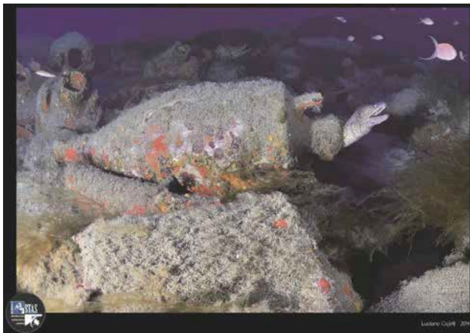
Figura 2 - Il relitto della Nave Romana di Albenga. Mostra fotosub organizzata dalla Soprintendenza per promuovere l'apertura delle visite sui relitti nel 2014.

Figure 2 - The Roman wreck of Albenga. Underwater photographic exhibition organized by Soprintendenza to promote the openings of the wrecks.