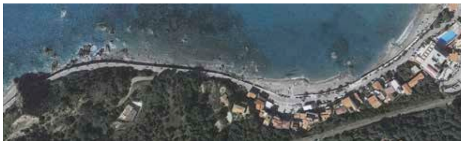
Figura 2 - Tratto costiero all'interno del Comune di Capo d'Orlando (Baia di San Gregorio). Figure 2 - Coastal stretch in Capo d'Orlando Municipality (bay of San Gregorio).

riconducibile ad alcune reti urbane policentriche e tre macro-sistemi territoriali ambientali. Particolare suggestione ancora oggi è offerta dall'arcipelago delle Isole Eolie che si trova posizionato a nord della costa tirrenica - proprio di fronte all'area dei Nebrodi- meta e riferimento di tanti leggendari viaggiatori 2 che offrono il loro teatro naturale derivante dal parossismo tardo pliocenico e pleistocenico. Le Isole Eolie sono raggiungibili mediamente tra i 25 e i 45 minuti di barca dai centri portuali di Milazzo, Capo d'Orlando e Sant'Agata di Militello 3 .