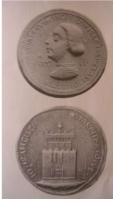
7. Gianfrancesco da Enzola, Medaglia di Pier Maria Rossi, 1455 (da G.F. Hill, Italian Medals , London 1930, n. 14).

inoltre che l'impresa del pellegrino appare in ambito rossiano non è in connessione con Bianca, ma con lo stesso Pietro Maria: infatti si trova nella medaglia eseguita nel 1455 da Gianfrancesco da Enzola [fig. 7]: il pezzo reca sul recto il profilo del conte con armatura e sul verso l'emblema del castello con le due insegne del pellegrinaggio e il sole raggiato che lo sovrasta 41 . E' già stata sottolineata la connessione tra le medaglie dell'Enzola, quelle di Sigismondo Malatesta e la rappresentazione dei castelli rossiani a Torrechiara 42 , ma si devono indicare anche fortissime differenze: infatti nella medaglia di Matteo de' Pasti la rappresentazione del castello allude a quello di Rimini che è il castello su cui si basa la forza del condottiero, che costruisce la sua immagine politica sul sistema difensivo del suo territorio, come viene ribadito nell'affresco di Piero della Francesca nel Tempio Malatestiano. Ci troviamo infatti di fronte ad un "ritratto architettonico"; nella medaglia di Pietro Maria invece il castello è assolutamente generico ed ha una valenza differente: per Sigismondo è il simbolo dell'autorità cittadina, per il Rossi è la meta del suo pellegrinaggio.