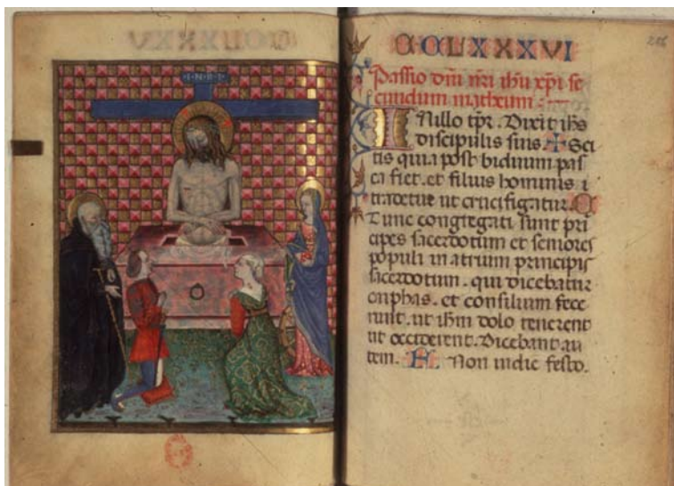
16. Paris, Bibliothèque Nationale de France, ms. Smith Lésoueff, f. ; Pier Maria Rossi in preghiera.

atteggiamento come protagonista secondaria, come conferma il confronto con i celebri ritratti di Francesco Sforza e Bianca Maria Visconti in Sant'Agostino a Cremona che i documenti assegnano a Bonifacio Bembo 69 .