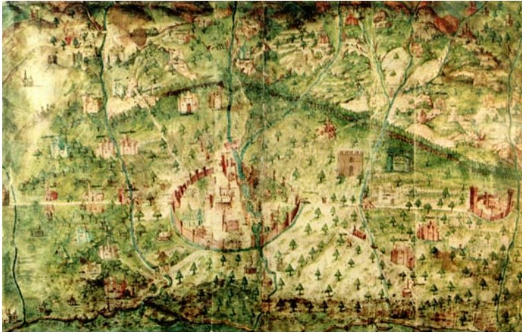
11. Parma, Archivio di Stato, Mappa del 1460.

topos della letteratura classica e cortese della visita del protagonista al Tempio della Fama 64 , con susseguente incontro con gli eroi del passato. Al concetto del Buon Governo comunale si sovrappone quello del principe rinascimentale, come idealmente partecipa della lunga tradizione degli eroi del passato, protagonisti di imprese epiche o intellettuali, alcuni dei quali, come Eracle, ancor oggi identificabili nei lacerti delle piccole sculture che affiorano tridimensionalmente nelle strutture architettoniche. Completa la figura del principe la dimensione intellettuale, data dall'interesse umanistico che compare nel programma decorativo dello studiolo, visivamente identificato come spazio di studio e di meditazione grazie all'uso del monocromo verde [fig. 14], tradizionalmente usato nelle biblioteche monastiche 65 : la scelta degli intellettuali