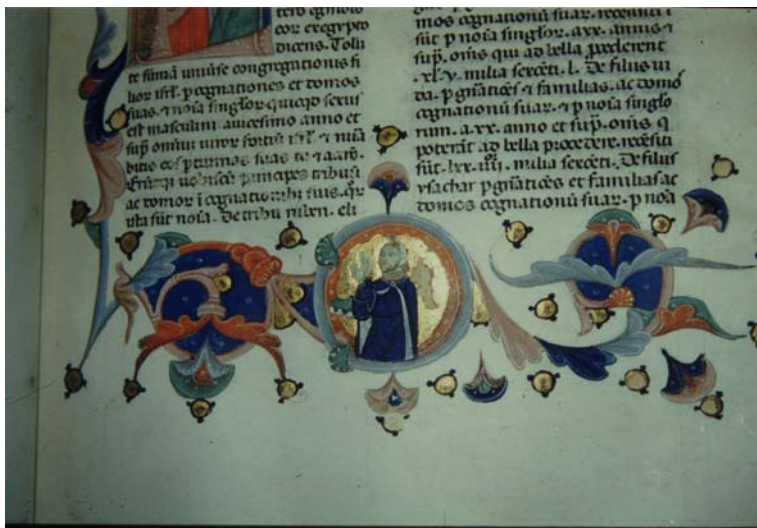
2. Genova, Biblioteca Durazzo, ms. B.IX.13, f. 57v: Bibbia dei Rossi .

giosi manoscritti liturgico-devozionali, i due Messali-Libri d'Ore 10 , e i codici di argomento classico fatti realizzare da una delle più prestigiose botteghe parigine, attiva anche per Gian Galeazzo Visconti, l' atelier del Ravanelle Master 11 ; nei primi due, attualmente conservati alla Bibliothèque nationale de France [fig. 3-4], il committente si fa ritrarre nel frontespizio, inginocchiato davanti alla Vergine, immediatamente riconoscibile a causa dell'abbigliamento, rigorosamente dell'eponimo colore. Nel ms. Lat. 757, destinato verosimilmente alla cappella di famiglia, come denuncia la scrittura su due colonne e le rubriche latine, Bertrando indossa abiti da corte con gioielli e l'impresa viscontea del sole raggiato, mentre la Vergine tra angeli musicanti e con ai piedi la falce lunare si presenta come la Regina dei cieli; nel più piccolo Smith Lesouëf 22, destinato all'uso privato, Maria è raffigurata seduta a terra, come Vergine dell'Umiltà, e il nobile parmense indossa semplici abiti rossi, mentre si inseriscono nella scena i santi intercessori, a spezzare l'orgoglioso rapporto diretto fra Bertrando e la Madre Divina. Nei due codici classici, traduzioni francesi della prima, terza e quarta decade di Livio (L'Aja, Koninklijke Bibliothek, ms. 71.A.16-17) e delle Epistolae ad Lucilium di Seneca (Bruxelles, Bibliothèque Royale Albert I er , ms. 9091), non vi sono ritratti, ma compare abbondante-