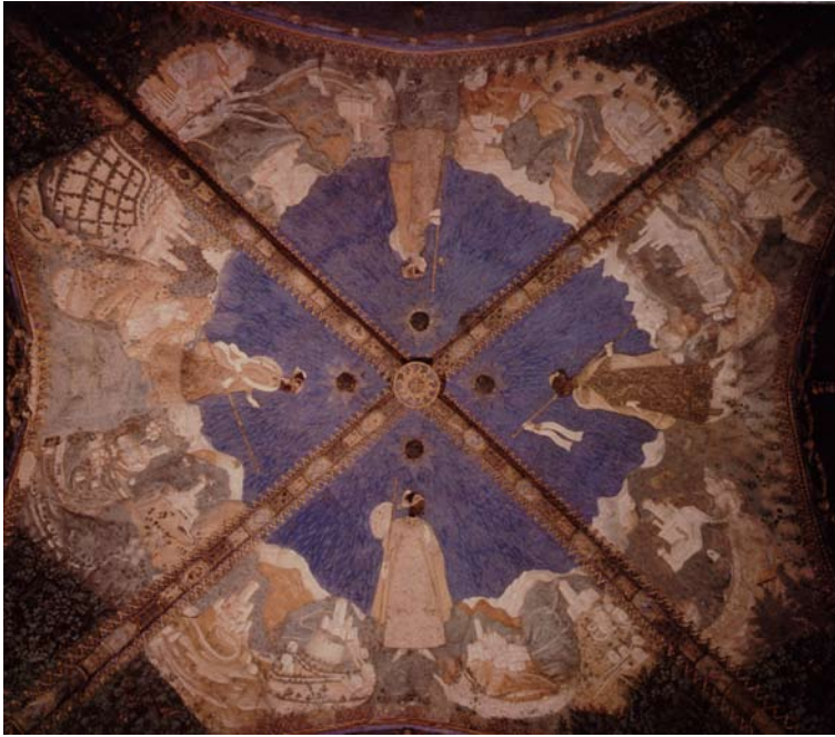
6. Torrechiarà (PR), Castello, Camera d'oro, Volta.