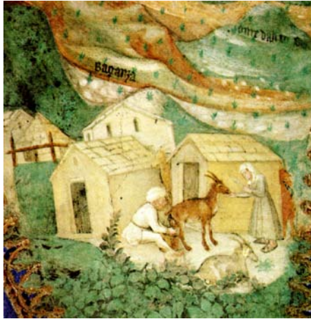
12. Torrechiera (PR), Castello, Camera d'oro, Mungitura.