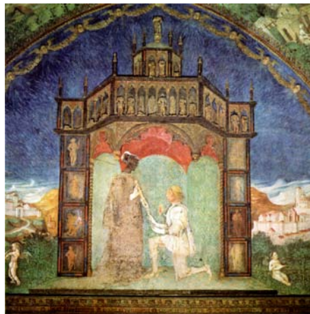
13. Torrechiera (PR), Castello, Camera d'oro, Tempio della Fama.

greci raffigurati nello studiolo, filosofi, statisti, oratori e poeti ben illustra gli interessi del committente, tanto più che la stanza doveva servire anche come archivio privato del Rossi, come attesta l'armadio scavato nella parete sud-ovest, mentre la presenza di un Christus patiens , sovrastato dalla preghiera « Cristus rex venit in pace et Deus homo factus est », solitamente iscritta nelle campane e nelle torri, perché recitata come difesa contro i fulmini e le bufere,