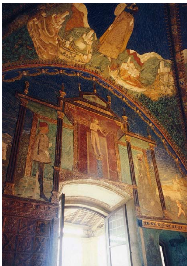
10. Torrechiara (PR), Castello, Camera d'oro.