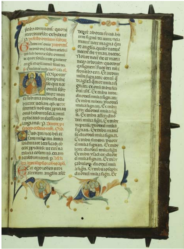
1. U.S.A., Coll. Priv., f. 240r: Messale dei Rossi .