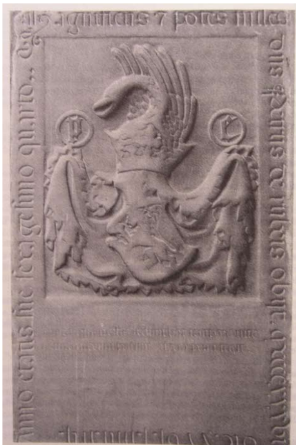
5. Parma, Chiesa di Sant'Antonio: Epigrafe di Pietro Rossi.

no della morte della moglie Antonia, e per contro si focalizza sul territorio, con un'azione accuratamente programmata che coinvolge, a partire dai tardi anni Trenta, tutti i punti chiave dei suoi domini e che porta alla ristrutturazione, secondo le nuove esigenze belliche, degli antichi insediamenti castellani o alla fondazione di nuovi castelli, come nel caso di Roccabianca e Torrechiara 21 . È ormai accettata universalmente l'ipotesi che Pietro Maria sia intervenuto personalmente nella progettazione del sistema difensivo 22 , ma troppo spesso si è