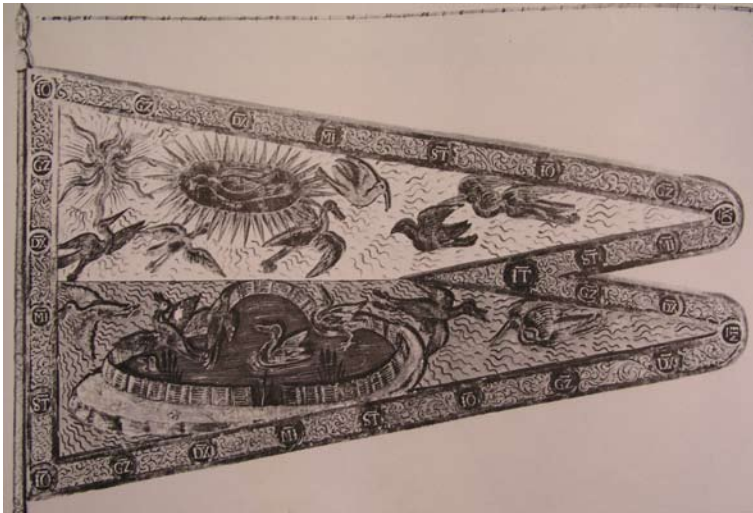
15. Stendardo di GianGaleazzo Visconti (da I Visconti a Milano , Milano 1977, fig. 114).

Certamente la relazione amorosa con Bianca Pellegrini ebbe un ruolo principale nella vita di Pietro Maria, e la sua celebrazione costituisce il primo livello della rappresentazione della camera peregrina aurea ; ma sotto questo livello altri compaiono, finalizzati alla celebrazione del Rossi, e in questi la funzione della bianca figura che si aggira è quella, ribadita dalle iscrizioni delle medaglie, di un simulacrum , immagine allegorica che rappresenta gli ideali di Pietro Maria, attestati innegabilmente dalla scultura che troneggiava sull'ingresso di Torrechiara, accompagnata dalla epigrafe «Invocato il nome della redemptrice / di cui pronomo porto io petro rosso / fonday sta rocca altiera et felice / M de magio quaranta octo era il corso C.C.C.C. / et cum divino aiuto fu perfecta / avanti chel sexanta fusse scorso» 68 . Conferma questa differente sfumatura anche il confronto con la scena di dedica, aggiunta al Libro d'Ore di Bertrando, ms. Smith Lesouëff 22 [fig. 16], che Pietro Maria fece completare per il proprio uso privato probabilmente dopo il 1468: Pietro Maria è rappresentato di profilo, inginocchiato come già nello stesso codice il nonno Bertrando, mentre Bianca è ripresa nell'atto di inginocchiarsi, in un