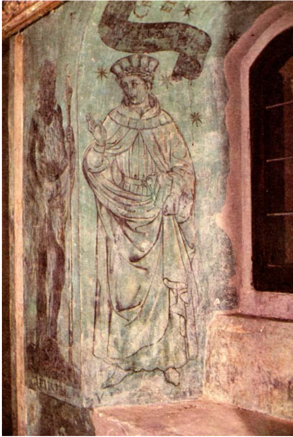
14. Torrechiara (PR), Castello, Camera d'oro, Studiolo.

ben testimonia la complessa cultura del committente e la sua devozione, cui rimanda in modo complesso ma inequivocabile l'idea stessa del pellegrinaggio.